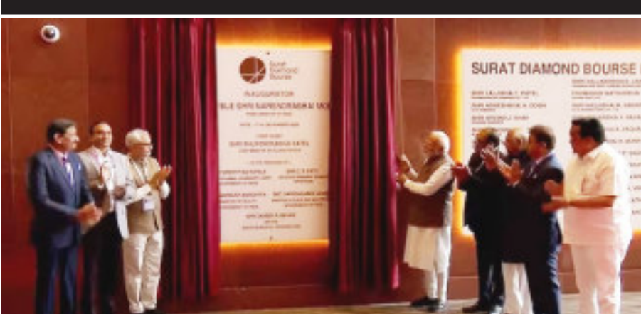
(પ્રતિનિધી દ્વારા) સુરત તા.૧૯ માર્ચ ૨૦૨૩

ડાયમંડ પોલિશીંગ કેપિટલ તરીકે વિશ્વમાં ખ્યાતનામ સુરત શહેરના હીરા ઉદ્યોગને મળશે નવી ચમક