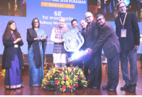
(પ્રતિનિધી દ્વારા) પશ્ચિમ રેલવેને વેચાણ

નવી દિલ્હી તા.૧૯ નવી દિલ્હીમાં આયોજિત ૬૮મા રેલ સપ્તાહની ઉજવણીમાં પશ્ચિમ રેલવેને વર્ષ ૨૦૨૩ માટે પાંચ શીલ્ડ અને સાત વ્યક્તિગત અતિ વિશિષ્ટ રેલ સેવા પુરસ્કારો પ્રાપ્ત થયા હતા. પશ્ચિમ રેલવેને વેચાણ પ્રબંધન, રેલ સહાય ક્ષેત્રે ઉત્કૃષ્ટ કામગીરી બદલ પ્રતિષ્ઠિત અતિ વિશિષ્ટ રેલ સેવા પુરસ્કાર શિલ્ડ પ્રાપ્ત કર્યાં. પશ્ચિમ રેલવેને ટ્રાફિક ટ્રાન્સપોર્ટેશન શીલ્ડ (દક્ષિણ પૂર્વ મધ્ય રેલવે સાથે સંયુક્ત રીતે), લેવલ કોસિંગ અને રોડ ઓવર/અંડર બ્રિજ