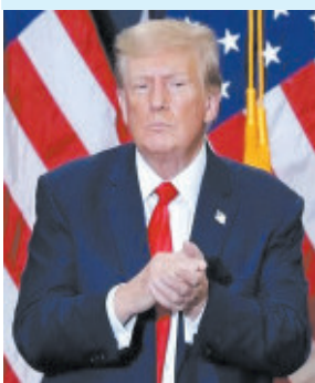
વોશિંગ્ટન, તા. ૨૦ અમેરિકાના ભૂતપૂર્વ રાષ્ટ્રપતિ ડોનાલ્ડ ટ્રમ્પ આવતા વર્ષે ૨૦૨૪માં યોજાનારી રાષ્ટ્રપતિની ચૂંટણીમાં ઉમેદવાર બની શકશે નહીં.

સુપ્રિમ કોર્ટે અમેરીકી બંધારણની સુધારા કલમ હેઠળ ટ્રમ્પને રાષ્ટ્રપતિ પદ સંભાળવા બદલ અયોગ્ય જાહેર કર્યા : કેપિટોલ હિલ હિંસા માટે ટ્રમ્પ જવાબદાર