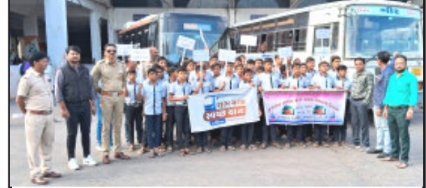
જૂનાગઢ, તા.૨૦ : જૂનાગઢ એસટી ડેપો ખાતે તા. ૧૯/૧૨/૨૦૨૩ના રોજ શુભ યાત્રા સ્વચ્છ યાત્રા ઉપક્રમે સ્વામિનારાયણ ગુરૂકુલના વિદ્યાર્થીઓ અને ડેપોના કર્મચારીઓ દ્વારા સ્વચ્છતા રેલીનો કાર્યક્રમ યોજાયો હતો.