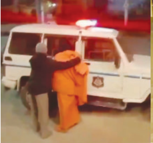
(પ્રતિનિધિ દ્વારા) જૂનાગઢ તા.૨૨ ભવનાથ વિસ્તારમાં આવેલા જાણીતા ધાર્મિક ક્ષેત્ર લોકોના માટે આસ્થાનું કેન્દ્ર બંધ અને ભાવિકો સંતોના દર્શન માટે તેમજ ધાર્મિક સંસ્થામાં દર્શન માટે આવતા

લોકો હોય છે. પરંતુ તાજેતરમાં બનેલી એક ઘટનામાં ધાર્મિક સ્થાનોની ગરીમાને લાંછન લાગે એવું અત્યંત શરમજનક કૃત્યું સામે આવ્યું છે. જેમાં મળતી વિગત અનુસાર, ભવનાથ ક્ષેત્રમાં આવેલા એક ધાર્મિક સ્થળમાં પાપલીલા થતી હોવાના બનાવનો પર્દાફાશ થયો છે. આ અંગે ચર્ચાતી વિગત અનુસાર એક ધર્મસ્થાનમાં એક મહિલા ખરાબ કૃત્ય કરતી હોવાનું સામે આવ્યું છે અને આ ઘટનાની સત્ય સાબિતી આપતી તસ્વીર પણ જોવા મળી છે. જેમાં ધાર્મિક