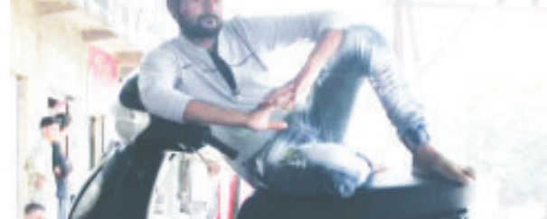
(ધીરૂ સોની દ્વારા) જૂનાગઢ તા.૨૨ શહેરનાં આંબેડકરનગર વિસ્તારમાં તાજેતરમાં એક યુવાન ઉપર છરી વડે હુમલાનો બનાવ થયો હતો. ગંભીર રીતે ઘવાયેલા આ યુવાનને સારવાર માટે સરકારી હોસ્પિટલમાં ખસેડવામાં આવ્યો હતો અને ત્યારબાદ વધુ સારવાર માટે રાજકોટ લઈ જવામાં આવેલ આ દરમિયાન છરી વડે હુમલાનો બનાવ થયો હતો.

લોકો હોય છે. પરંતુ તાજેતરમાં બનેલી એક ઘટનામાં ધાર્મિક સ્થાનોની ગરીમાને લાંછન લાગે એવું અત્યંત શરમજનક કૃત્યું સામે આવ્યું છે. જેમાં મળતી વિગત અનુસાર, ભવનાથ ક્ષેત્રમાં આવેલા એક ધાર્મિક સ્થળમાં પાપલીલા થતી હોવાના બનાવનો પર્દાફાશ થયો છે. આ અંગે ચર્ચાતી વિગત અનુસાર એક ધર્મસ્થાનમાં એક મહિલા ખરાબ કૃત્ય કરતી હોવાનું સામે આવ્યું છે અને આ ઘટનાની સત્ય સાબિતી આપતી તસ્વીર પણ જોવા મળી છે. જેમાં ધાર્મિક