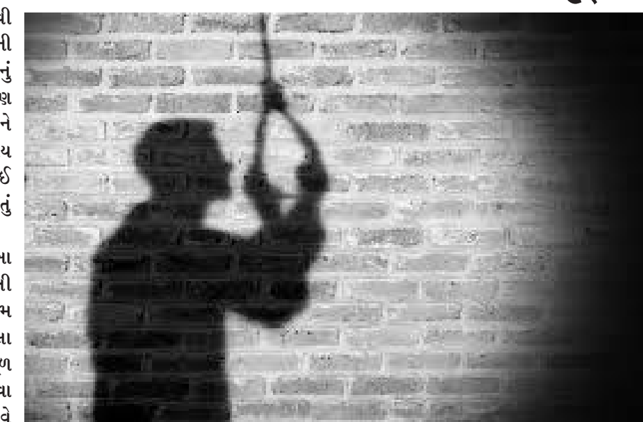
ડોક્ટર-એન્જિનિયર કે મેળવવા માટે વિદ્યાર્થીને કેટલો ઉચ્ચલીવટી અધિકારી બનવું એ જ એક યોગ્ય વિકલ્પ છે. પણ આ પરીક્ષાઓમાં સફળતા

અને આ સમગ્ર સિસ્ટમ ક્યા સ્તરે કડ્ડણ પરિસ્થિતિનું નિર્માણ કરી રહી છે જેમાં કિશોરાવસ્થાના બાળકોને જીવન અથવા મૃત્યુ વચ્ચેની પસંદગીનો સામનો કરવો પડી રહ્યો છે. આ વર્ષે વિદ્યાર્થીની આત્મહત્યાની આ બીજી ઘટના છે. જ્યારે આવી ઘટના વ્યાપક ચર્ચાનો વિષય બને છે અને લોકો દ્વારા ચિંતા વ્યક્ત કરવામાં આવે છે, ત્યારે તેના ઉકેલ માટે વિવિધ સ્તરે પગલાં લેવાની વાતો કરવામાં આવે છે. પરંતુ કદાચ આ સમસ્યાના મૂળને ઓળખવા અને તે મુજબના નક્કર ઉકેલો શોધવા માટે કોઈ પહેલ કરવામાં આવી રહી નથી. પ્રશ્ન એ છે કે કિશોરાવસ્થામાં બાળકો અનેક પ્રકારની માનસિક અને શારીરિક મુશ્કેલીઓમાંથી પસાર થાય છે ત્યારે શિક્ષણ અને ભવિષ્યની ચિંતા સાથે તેમના માથે આ બોજ કોણ નાખે છે? આ પછી, આ ચિંતાનો લાભ ઉઠાવવા માટે, કોચિંગ સંસ્થાઓએ જે કડક વ્યવસ્થા ઊભી કરી છે અને જે રીતે અનેક બાળકો તેની નીચે કચડાઈ રહ્યાં છે તેના ઉપર કોઈ નિયંત્રણ કેમ રાખવામા આવતું નથી? સરકારોને આ અંગે કોઈ સ્પષ્ટ અને નક્કર નીતિ બનાવવાની જરૂર કેમ લાગતી નથી? કોટામાં છેલ્લા ઘણા સમયથી સતત આવી પરીક્ષાઓની તૈયારી કરી રહેલા વિદ્યાર્થીઓની આત્મહત્યા હવે વ્યાપક ચિંતાનો વિષય બની