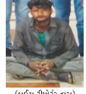
(કાર્થમ રીપોર્ટર દ્વારા) જૂનાગઢ તા. ૩ ઝડપી લઈ બી ડીવીઝન