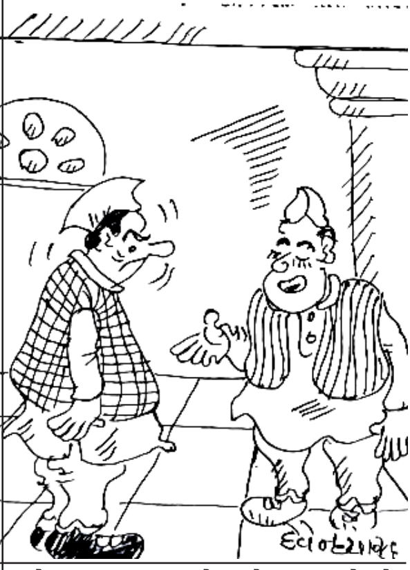
બજેટ કદાચ સાડા હોય તોય આપણે તો વિરોધ કરવાનો છે, એ નભુલી જતો!

ટનલ બનાવવાની કામગીરી તેમજ સ્ટેશનોની કામગીરી પણ ઝડપથી કરાઈ રહી છે. હાલમાં ૨૮૦ કિલોમીટર લાંબા ટ્રેકની કામગીરી પૂર્ણ કરી દેવા છે અને દર મહિના ૧૩ થી ૧૪ કિલોમીટરની કામગીરી પૂર્ણ કરવામાં આવે છે.' આ સાથે તેમણે ઉમેર્યું કે, ૨૦૦૯ થી ૨૦૧૪ વચ્ચે ગુજરાતને સરેરાશ ૫૮૯ કરોડ રૂપિયા ફાળવવામાં આવતા હતા. પરંતુ હાલની સરકારે આ વખતે ગુજરાત માટે ૮૫૮૭ કરોડ રૂપિયા ફાળવ્યા છે. હાલમાં ગુજરાતમાં ૭૦૧ કિલોમીટર રૂટ પર નવી લાઈન તેમજ ગેજ કન્વર્ઝનની કામગીરી ચાલી રહી છે. ગુજરાતમાં ઈલેક્ટ્રીફિકેશનની કામગીરી પણ ઝડપથી ચાલી રહી છે અને હાલમાં લગભગ ૯૭ ટકા ટ્રેકનું ઈલેક્ટ્રીફિકેશન કામ પૂર્ણ કરી દેવામાં આવ્યું છે. ગુજરાતમાં અમદાવાદ, વડોદરા, સુરત, રાજકોટ, સોમનાથ સહિત ૮૭ સ્ટેશનો રિડેવલપ કરવામાં આવશે. જેમાં હાલ સુરત, વડોદરા, સોમનાથ સ્ટેશનના ડેવલપમેન્ટની કામગીરી ચાલી રહી છે જ્યારે અમદાવાદ સ્ટેશન પર ઓફિસોની શિક્કિંગ ચાલુ છે અને આગામી દિવસોમાં ડેવલપમેન્ટ કામગીરી શરૂ કરવામાં આવશે.'