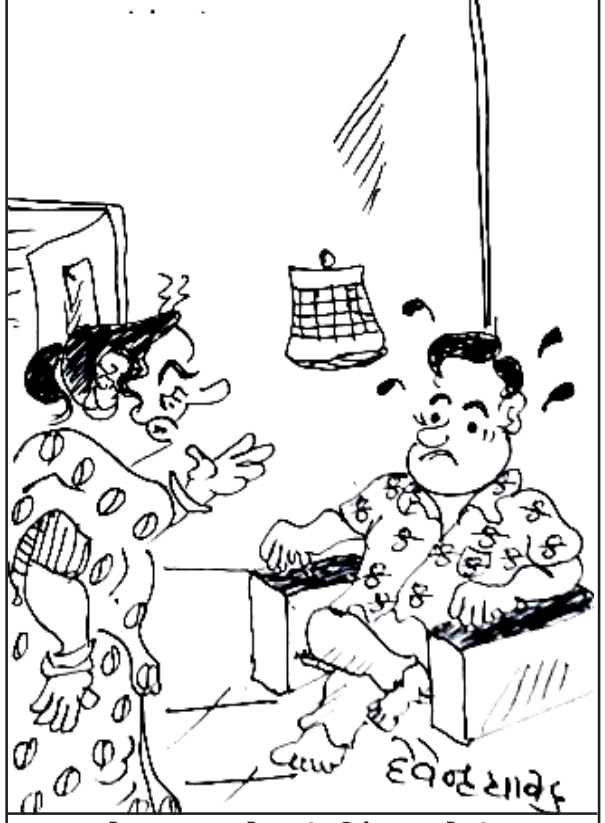
દેશના બજેટની ચિંતા છોડી ઘરના બજેટમાં ધ્યાન આપો!