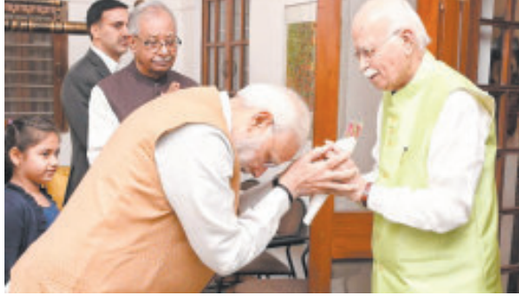
આવશે. મેં તેમની સાથે વાત કરી અને તેમને આ ખિતાબથી સન્માનીત કરવામાં આવી રહ્યા હોવા અંગે અભિનંદન પાઠવ્યા હતા. તેઓ આપણા સમયનાં ખુબજ સન્માનીય વ્યક્તિ છે. દેશનાં વિકાસમાં તેમનું યોગદાન એક સીમાથી વધુ છે. તેમણે દેશ સેવાનું કાર્ય ગ્રાઉન્ડ લેવલથી શરૂ કર્યું હતું અને ભારતનાં નાયબ વડાપ્રધાન તરીકે તેમજ તત્કાલીન માહિતી અને પ્રસારણ મંત્રી તરીકે યોગદાન અમુલ્ય હતું. તેમની

આવશે. વડાપ્રધાન નરેન્દ્ર મોદીએ આજે જાતે જ સોશિયલ મીડીયા પર આ જાણકારી આપી હતી. વડાપ્રધાન મોદીએ આ માહિતી આપતા પહેલા એલ. કે. અડવાણી સાથે મુલાકાત કરી વાતચીત કરી હતી અને તેમને ભારત રત્નથી સન્માનીત કરવાની વાત જણાવી હતી. અને