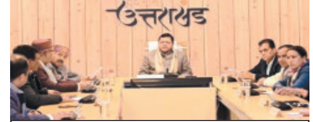
યુનિફોર્મ સિવિલ કોડની કેટલીક મહત્વની જોગવાઈઓ

સહિત સમગ્ર ઉત્તરાખંડ રાજ્યમાં સુરક્ષા વધારી દેવામાં આવી છે. વિધેયકનો મુસદ્દો તૈયાર કરવા માટે ખાસ સમીતીનું ગઠન કરવામાં આવ્યું હતું. તેના દ્વારા વિભિન્ન ધર્મો, જૂથો, સામાન્ય નાગરિકો તથા રાજકીય પક્ષો સાથે ચર્ચા બેઠકો કરીને