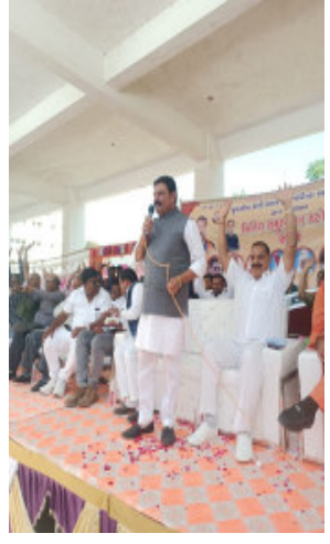
જૂનાગઢ તા. ૯ ગિરિવર ગિરનારની ગોદમાં ગોરક્ષનાથ આશ્રમની સામે આવેલ સંતશ્રી વેલનાથ બાપુના પટાંગણમાં આવેલ ડુમમાં ચૂવાળીયા કોળી સમાજ