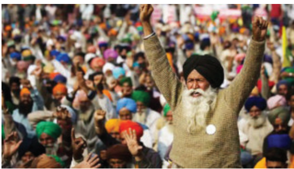
નવી દિલ્હી તા. ૧૩ ફેબ્રુઆરી. ખેડૂતો આજે દિલ્હી તરફ કૂચ કરી રહ્યા છે. ગતરાત ચંદીગઢમાં સાડા પાંચ કલાક સુધી ચાલેલી

બેઠકમાં કૃષિ પાકોના લઘુત્તમ ટેકાના ભાવ (એમએસપી) મામલે ખેડૂતો નેતાઓ અને કેન્દ્રીય નેતાઓ વચ્ચે યોજાયેલી મંત્રણા નિષ્ફળ રહેતા ખેડૂતોએ દિલ્હી કુચ જારી રાખતા પંજાબ હરીયાણા સ્થિત શંભુ બોર્ડર ઉપર ખેડૂતો અને પોલીસ વચ્ચે ઘર્ષણ થયું છે. ખેડૂતોને વિખેરી નાંખવા માટે પોલીસે ટીયર ગેસના સેલ છોડ્યા હતા. તેમજ લાટી ચાર્જનો પણ આસરો લીધો હતો. શંભુ બોર્ડર ખાતે સ્થિતી અત્યંત સ્ફોટક બની ગઈ છે. ડ્રોન દ્વારા પોલીસે ટીયર ગેસ છોડ્યો હતો. શંભુ બોર્ડર ઉપર પરિસ્થિતી નિયંત્રણ બહાર જતા હોવાના સંકેતો મળી રહ્યા છે. ખેડૂતોને દિલ્હીમાં પ્રવેશતા અટકાવવા શંભુ બોર્ડર, સિન્ધુ બોર્ડર અને ટીકરી બોર્ડર સીલ કરી નાખવામાં આવી છે. ખેડૂત નેતાઓ અને કેન્દ્રીય મંત્રીઓ વચ્ચે લઘુત્તમ ટેકાના ભાવ (MSP) ગેરંટી કાયદા અને લોન માફી પર કોઈ સંમતિ થઈ શકી નથી. આ પછી કિસાન મજદૂર