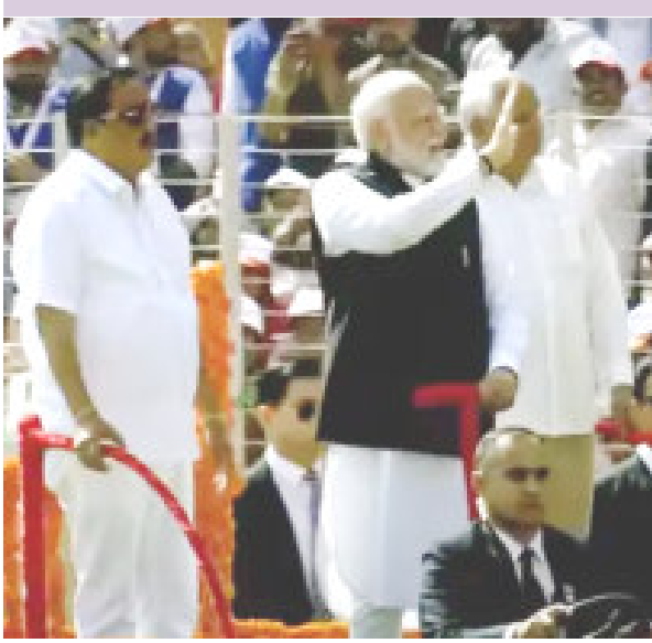
અમદાવાદ તા.૨૨ ગુજરાતની મુલાકાતે છે. સવારે વડાપ્રધાન નરેન્દ્ર મોદી આજે ૧૦:૨૦ વાગ્યે અમદાવાદ એરપોર્ટ

ઉપર પહોંચ્યા હતા. જ્યાં મુખ્યમંત્રી ભૂપેન્દ્ર પટેલ અને અમદાવાદના મેયર પ્રતિભા જેન દ્વારા તેઓનું સ્વાગત કરવામાં આવ્યું હતું. નરેન્દ્ર મોદી સ્ટેડિયમમાં અમુલ ફેડરેશનના ગોલ્ડન જ્યુબીલી કાર્યક્રમમાં હાજરી આપી હતી. અહીં ઓપન જીપમાં નરેન્દ્ર મોદી ભૂપેન્દ્ર પટેલ અને સી.આર. પાટીલ સાથે સવાર થઈ ખેડૂતો અને લોકોનું અભિવાદન કરી રહ્યાં હતાં. બાદમાં નરેન્દ્ર મોદીએ પ્રાસંગિક સંબોધન કર્યું હતું. જેમાં તેઓએ જણાવ્યું હતું કે, પશુપાલકો માટે ૩૦ હજાર કરોડનું એક અલગ ફંડ બનાવ્યું છે. રૂા.૧૦ લાખ કરોડ ટર્નઓવરવાળી ડેરી સેક્ટરની મોટી કર્તાવિતા આપણી માતાઓ અને બહેનો છે. આ કાર્યક્રમને લઈને વહેલી સવારથી જ રાજ્યના વિવિધ શહેરો અને જિલ્લાઓમાંથી ખેડૂતો વડાપ્રધાનના કાર્યક્રમમાં પહોંચ્યા હતા. સ્ટેડિયમની અંદર અને બહારના ભાગે યુસ્ત પોલીસ બંદોબસ્ત ગોઠવી દેવામાં આવ્યો હતો. નરેન્દ્ર મોદી સ્ટેડિયમ લોકોથી ખીચોખીચ ભરાઈ ગયું હતું. નરેન્દ્ર મોદીએ જણાવ્યું હતું કે, સરકારે ૬૦ હજારથી વધુ અમુલ સરોવર બનાવ્યા છે. અમારો પ્રયાસ છે કે ગામડાના નાનામાં નાના ખેડૂતને આધુનિક ટેકનોલોજીથી જોડવામાં આવે. લાખો 'કિસાન સમૃદ્ધિ કેન્દ્ર' સ્થાપ્યા છે. અમારી સરકાર ખેડૂતોને સોલાર પંચ આપી રહી છે. દેશમાં ૧૦ હજાર ખેડૂત