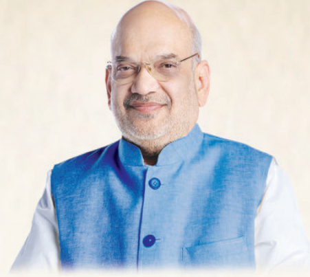
શ્રી અમિત શાહ માનનીય ગૃહ બાબતો અને સહકારિતા મંત્રી