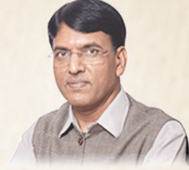
ડૉ. મનસુખ માંડવિયા માનનીય કેન્દ્રીય આરોગ્ય અને પરિવાર કલ્યાણ અને રસાયણ અને ખાતર મંત્રી

આપણા માનનીય પ્રધાનમંત્રી શ્રી નરેન્દ્ર મોદી ના વિઝન સાથે