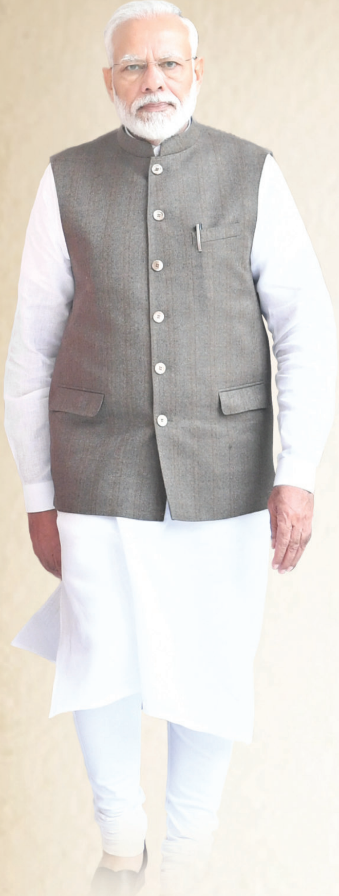
શ્રી નરેન્દ્ર મોદી માનનીય પ્રધાનમંત્રી