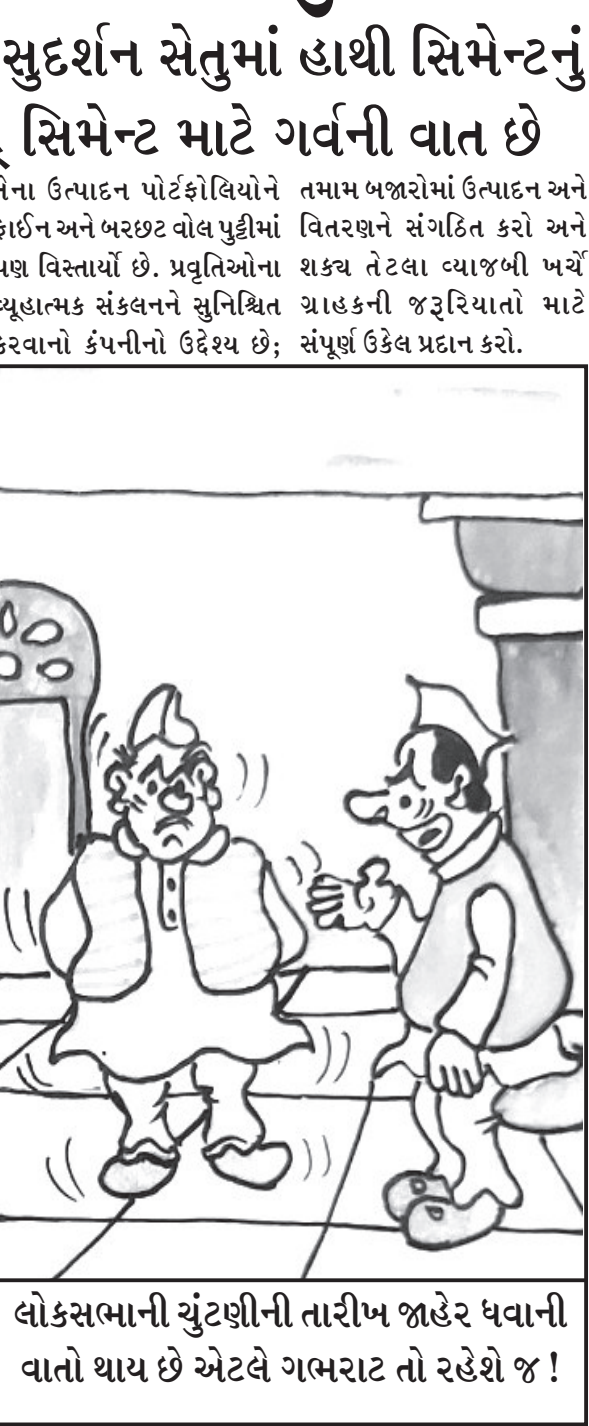
તમારા વિવાદાસ્પદ નિવેદનોની હવે કોઈ નોંધ પણ નથી લેતું !

દ્વારકા ખાતે બનાવવામાં આવેલ સુદર્શન સેતુમાં હાથી સિમેન્ટનું અતુલ્ય યોગદાન છે જે સૌરાષ્ટ્ર સિમેન્ટ માટે ગર્વની વાત છે હવે ઈન્દિરિયર, એક્સટીરિયર પેઈન્ટ્સ અને “સ્નોકેર” રેન્જ જેવી કે પુટ્ટી, પ્રાઈમર્સ, કન્સ્ટ્રક્શન કેમિકલ્સ અને અન્ય વિવિધ ઉપયોગ માટે કંપની પાસે હવે ઘણી બધી પ્રોડક્ટ્સની સંપૂર્ણ શ્રેણી પણ છે. કંપનીએ તાજેતરમાં “હાથી પુટ્ટી” અને પ્રીમિયમ વેરિયંટ સિમેન્ટ “હાથી પ્રાઈમ” લોન્ચ કરીને તેના ઉત્પાદન પોર્ટફોલિયોને તમામ બજારોમાં ઉત્પાદન અને વિતરણને સંગઠિત કરો અને શક્ય તેટલા વ્યાજબી ખર્ચે ગ્રાહકની જરૂરિયાતો માટે કરવાનો કંપનીનો ઉદ્દેશ્ય છે; સંપૂર્ણ ઉકેલ પ્રદાન કરો.