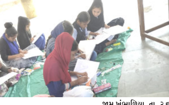
જામ મંભાળિયા, તા. ૨૬

દેવભૂમિ દ્વારકા ખાતે વડાપ્રધાન નરેન્દ્ર મોદી સુદર્શન સેતુનું લોકાર્પણ કરશે. ત્યારે દ્વારકાની સરકારી પ્રાથમિક શાળાઓ તેમજ સરકારી માધ્યમિક શાળાઓમાં ગઈકાલે શુક્રવારે ચિત્ર સ્પર્ધાનું આયોજન કરવામાં આવ્યું હતું. દ્વારકામાં બીઆરસી ભવન ખાતે ૧૨ શાળાના ૧૦૦ જેટલા વિદ્યાર્થીઓએ આ સ્પર્ધામાં ભાગ લીધો હતો. ઓખા તાલુકા શાળા નંબર ૧ ખાતે ત્રણ શાળાના ૫૦ જેટલા છાત્રોએ તેમજ બેટ કન્યા શાળામાં ૩ શાળાના ૩૦ છાત્રો ભાગ લીધો હતો. જેમાં છાત્રોએ શ્રીકૃષ્ણ જીવનશૈલી આધારિત, સુદર્શન સેતુના સ્કેચ બનાવ્યા હતા. ભાગ લેનારા તમામ વિદ્યાર્થીઓને મીઠાપુરની ટાટા કંપની તરફથી ડ્રોઈંગ કીટ ટાટા આપવામાં આવી હતી. સાથે પ્રાથમિક અને માધ્યમિક વિભાગમાં પ્રથમ ત્રણ ક્રમાંક પ્રાપ્ત કરનાર વિજેતાને ઈનામ કેન વેદાંત ફાઉન્ડેશન તરફથી પણ પ્રોત્સાહક ઈનામ આપવામાં આવ્યા હતા.