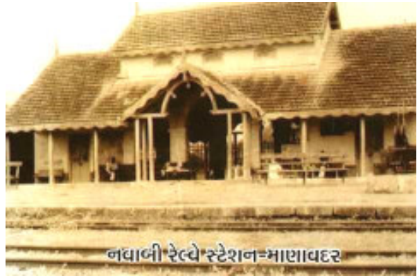
નવાબી રેલ્વે સ્ટેશન-માણાવદર