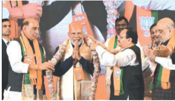
નવી દિલ્હી તા. ૨૯ પસંદગી માટે આજે ભાજપની આગામી લોકસભા ચૂંટણી કેન્દ્રીય ચૂંટણી સમીતીની પ્રથમ માટેના ઉમેદવારોની આખરી બેઠક સાંજે યોજાશે અને તેમાં

દિલ્હી ખાતે કેન્દ્રીય ચૂંટણી સમિતિની બેઠક બાદ સાંજે ઉમેદવાર પસંદગીની ગમે ત્યારે જાહેરાત