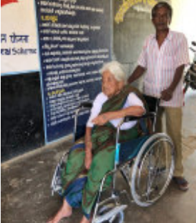
અમદાવાદ, તા.૨૨ આગામી લોકસભાની ચૂંટણીને લઈને મતદાન મથકો ઉપર પુરતી સુવિધા રાખવા માટે આદેશ કરાયો છે.

અમદાવાદ, તા.૨૨ આગામી લોકસભાની ચૂંટણીને લઈને મતદાન મથકો ઉપર પુરતી સુવિધા રાખવા માટે આદેશ કરાયો છે. જેમાં રાનચની જે સ્કૂલોમાં મતદાન મથક છે તે સ્કૂલોના આચાર્યોને પત્ર લખી જિલ્લા શિક્ષણાધિકારીએ આદેશ કર્યો છે. જેમાં જણાવ્યું છે કે, મતદાન માટે દિવ્યાંગ મતદારો માટે રેમ્પ તથા વ્હીલચેરની વ્યવસ્થા કરવાની રહેશે. ઉપરાંત મતદાન કેન્દ્રો ઉપર પીવાનું પાણી, ટોઈલેટ, ઈલેક્ટ્રીસિટી સહિતની સુવિધા સુનિશ્ચિત કરવાની રહેશે. પ્રાથમ માહિતી અનુસાર, લોકસભાની ચૂંટણીની જાહેરાત સાથે જ રાજ્યમાં મતદાનની તડામાર તૈયારીઓ શરૂ કરી દેવામાં આવી છે. જેમાં મતદાનના દિવસે જે બુથ ઉપર મતદાન થવાનું છે ત્યાંની સુવિધા સુનિશ્ચિત કરવામાં આવી રહ્યું જાહેર કરવામાં આવેલું છે. રાજ્યના