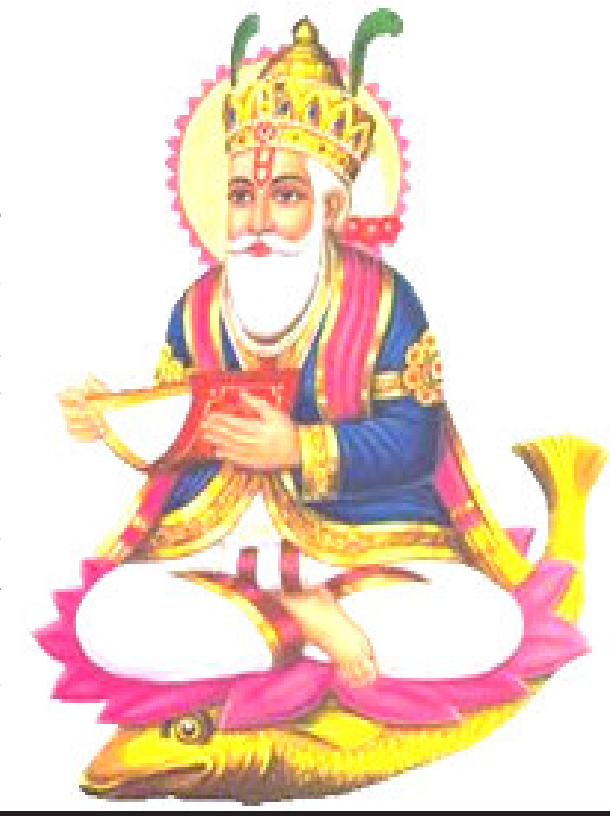
સંકલન : સરસ્વતી હાઈસ્કૂલ, જૂનાગઢ

તેમનું વાહન માછલી છે. ભક્તો તેમને ઉદરોલાલ, ઘોડેવારો, જિન્દપીર, લાલસાઈ, પલ્લેવારો, જયોતિનવારો, અમરલાલ વગેરે નામથી પણ પૂજે છે. જુલેલાલ સાહેબ જળ અને અગ્નિનો અવતાર છે તેથી ચેટીચંદ નિમિત્તે કાષ્ઠનું (લાકડાનું) મંદિર બનાવીને તેમાં સવાકિલો લોટ બાંધી તેનું કોડિયું બનાવી લાકડાના મંદિરમાં તે કોડિયું મૂકી તેમાં ચાર જયોત પ્રગટાવવામાં આવે છે. આ મંદિરને બરિહાણા સાહેબ પણ કહેવામાં આવે છે. મંદિરને શ્રધ્ધાળુ ભક્તો ચેટીચંદના દિવસે માથા પર ઉચકી વરુણદેવની સ્તુતિ કરે છે. મંદિરને લઈ તેમાં જુલેલાલજીની મૂર્તિ સ્થાપિતેને ઘરેઘરે ફેરવે છે. બીજા દિવસે મંદિરમાં પ્રગટાવેલ