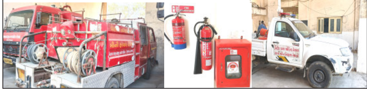
(ભાસ્કર વૈદ્ય દ્વારા)

૧૪ એપ્રિલ ૧૯૪૪ મુંબઈના વિક્ટોરીયા ડોક-પોર્ટમાં જહાજમાં બ્લાસ્ટ સાથે લાગેલી આગમાં શહીદ થયેલા ફાયર બ્રિગેડના જવાનોને શ્રધ્ધાંજલી આપવા ગીર સોમનાથ-વેરાવળ-ફાયર બ્રિગેડ દ્વારા શોકદર્શક, જાગૃતી પ્રેરક કાર્યક્રમો