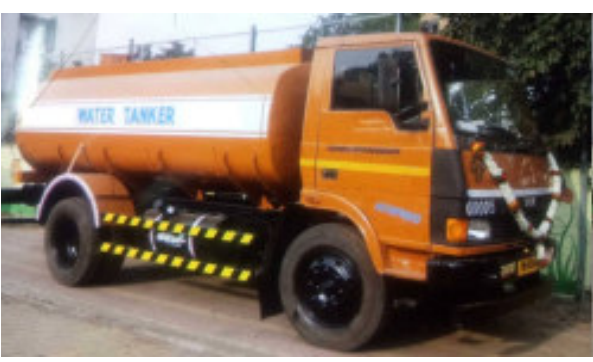
ભાવનગર, તા. ૧૩ પોકાર શરૂ થઈ ગયો છે. ઉનાળાની શરૂઆત થતા જ રાજ્યની સરકાર અને ભાવનગર શહેરમાં પાણીનો ભાવનગર મહાનગરપાલિકા

મિસ પ્લાનિંગના કારણે શહેરમાં પીવાના પાણીની સમસ્યાનું નિરાકરણ ૩૦ વર્ષ પછી પણ લાવી શકી નથી દ્વારા વિવિધ યોજના થકી પીવાના પાણીનું નિવારણ લાવવા માટે ૧૬૦ કરોડ રૂપિયાના ખર્ચે નર્મદાની લાઈન શહેરમાં પહોંચાડવામાં આવી છે તો મ.ન.પાયે વિવિધ વિસ્તારોમાં કરોડો રૂપિયાના ખર્ચે ૧૩ જેટલા અમૃત સરોવર બંધાવ્યા છે. પરંતુ આમ છતાં ભાવનગર શહેરમાં દર મહિને ૮૦૦ જેટલા ટેકરો વિવિધ વિસ્તારોમાં પીવાનું પાણી પૂરું પાડી રહ્યા છે જેનો ખર્ચ ૨ કરોડ અને ૬૦ લાખ રૂપિયા જેવો દર મહિને ભાવનગર મહાનગરપાલિકા પાણી વિતરણ માટે ખર્ચ કરી રહી છે જેનો સીધો જ ખોજો જનતાના કમર પર આવી રહ્યો છે. ભાવનગર નાખી દેવામાં આવ્યા પરંતુ આ નળ કનેક્શનમાં પાણી તો આવતું નથી પરંતુ નળ કનેક્શનના નામે ટેક્સ પૂરેપૂરો ઉઘરાવવામાં આવે છે. જેના એક નહીં પરંતુ અનેક કિસ્સાઓ બહાર આવ્યા છે. ઉનાળાની શરૂઆત થતા જ દર વર્ષની પરંપરાગત મુજબ ભાવનગર શહેરમાં ટેકર રાજ શરૂ થતું હોય છે જેનાથી ભાવનગર શહેરમાં લોકોને પીવાના પાણી પહોંચાડી શકાય.