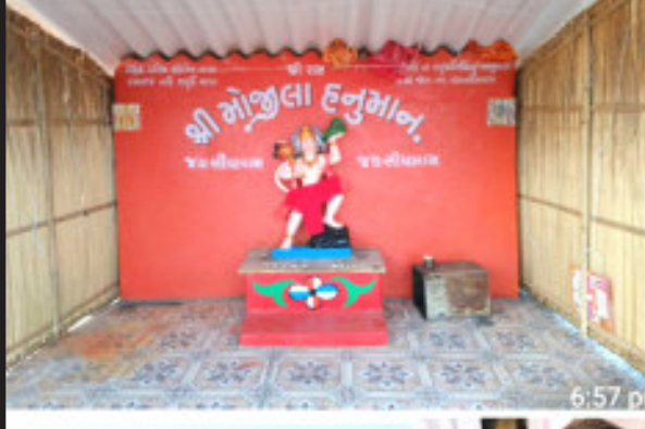
(પ્રતિનિધી દ્વારા) જરગલી ગામના પાટિયા પાસે ઉના તા. ૧૩ આવેલ સેકડો લોકો નું આસ્થા નું ઊનાના ગીરગઢડા તાલુકાના પ્રતિક મોજલા હનુમાન મંદિર

(પ્રતિનિધી દ્વારા) યજ્ઞમાં બેસી માતા વેરાઈને સર્વજન હિતાયની પ્રાર્થના કરી રાજકોટ, તા.૧૨ જગતજનની માં ભગવતી વેરાઈ માતાજીની પ્રેરણાથી સમસ્ત વધાસિયા પરીવારના રણખાંભીના સુરાપુરા પાતાદાદાની પ્રેરણાથી દિવ્યધામ ખાતે ચૈત્ર સુદ એકમ એટલે કે ચૈત્રી નવરાત્રીની શુભારંભથી આગામી ૧ વર્ષ સુધી ૨૪ કલાક અખંડ હોમાંક યજ્ઞ યોજાશે. આ યજ્ઞમાં રોજે રોજ ગુજરાતનાં અલગ અલગ ગામોએથી વધાસિયા પરિવાર એક દિવસ મહાયાગ યજ્ઞનું આયોજન ફાગણસુદી બીજનાં દિવસે કરવામાં આવ્યું હતું. પધારેલ હજારો ભાવીકોએ જળસંસય અને જળસિંચનની જાગૃતી લાવવા જળયાત્રા સ્વરૂપે પાતાદાદાનાં નીજ મંદીરથી યજ્ઞ સ્થળ સુધી યાત્રા યોજી હતી. અત્રે ઉલ્લેખનિય છે કે, દિવ્યધામએ વધાસિયા પરિવાર દ્વારા માતા વેરાઈની આરાધનાનું તપસ્વી ૩૦૦૦ થી માળાઓનું વિતરણ કરાઈ ચુક્યું છે. તાજેતરમાં દિવ્યધામ ખાતે ૫૧ કુંડી ગુજરાતભરમાંથી લોકો પોતાની શ્રધ્ધા અને આસ્થા સાથે અહીં દેવદર્શન કરવા પધારતા હોય છે, ત્યારે યાત્રીકોની સુખાકારી માટે યાત્રીભવનનું નિર્માણ દિવ્યભવનનાં રૂપે સાકાર થઈ રહ્યું છે. વલારડી દિવ્યધામ વધાસિયા પરિવારોમાં એક આસ્થા સાથે શ્રધ્ધાનું ભળ પુરૂ પાડનાર કેન્દ્ર બની રહ્યું છે. અહીં પધારનાર ભાવીકોની મનોકામનાં પુર્ણ થતી હોવાની પ્રતિતી ભાવીકોમાં સાંભળવા મળે છે.