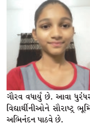
ગૌરવ વધાર્યું છે. આવા ધુરંધર વિદ્યાર્થીનીઓને સૌરાષ્ટ્ર ભૂમિ અભિનંદન પાઠવે છે.

વિદ્યાર્થીનીએ નિર્ણાયકોને સુંજવતા કરી દીધા હતા. આ વિદ્યાર્થીનીએ ડો. બાબા સાહેબ આંબેડકરના જીવનથી મુલ્યું સુધી તમામ કાર્યશૈલીઓ, સામાજિક પ્રવૃત્તિઓ, જીવનશૈલીની તારીખ વર્ષ સાથે રજૂ કરી ૫૦૦ શબ્દોમાં ૩૦ મિનીટની અંદર પુર્ણ કરી એક ઉત્તમ ઉદાહરણ પુરૂ પાડેલ હતું. અંદરના સુત્રો દ્વારા એવું પણ જણવા મળેલ છે કે અમદાવાદ ખાતે ડો. આંબેડકર નિબંધની સ્પર્ધામાં રાજ્યકક્ષાએ બીજો નંબર મેળવેલ અને તે સમયના જીલ્લા શિક્ષણ અધિકારી ડોડીયાના હસ્તે ઈનામો અર્પણ કરેલ અને બીજી માહિતી એવી પણ મળી રહી છે કે ૧૪ એપ્રિલના રાત્રે ૯ કલાકે મેઘવાડ સમાજ દ્વારા આ વિદ્યાર્થીનીને સન્માનીત કરવાનું આયોજન થયેલ છે. આમ તેણે કેશોદનું