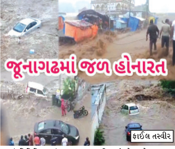
જૂનાગઢમાં જળહોનારત (પ્રતિનિધિ દ્વારા) ચાલી રહ્યું છે અને નજીકના જૂનાગઢ તા.૧૩ સમયમાં ચૂંટણી યોજાઈ રહી છે જૂનાગઢ લોકસભાની બેઠક અને રાજકીય પક્ષો તેમજ માટેનું પ્રચાર પડઘમ જોરશોરથી સંબંધિત તંત્ર ચૂંટણીની

જળહોનારતની ઘટનાને એક વર્ષ પુરૂ થવામાં છે પરંતુ આ સમયગાળામાં કથિત દબાણો દુર કરવાની કે સુરક્ષા માટેના કોઈ પગલા લેવાયા નથી, જનતા વ્યથિત