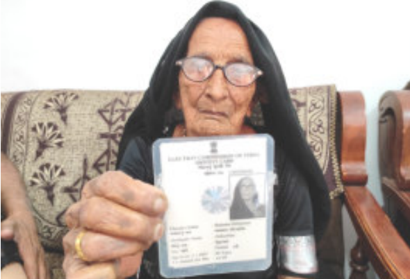
(પ્રતિનિધી દ્વારા) ગીર સોમનાથ જીલ્લા પ્રભાસ પાટણ તા. ૧૩ જૂનાગઢ સંસદીય મત વિસ્તારની

બેઠકનું ૭મી મેના રોજ મતદાન કરી શકે છે. તેઓએ નવા અને તમામ મતદારોને ખાસ અપીલ કરતા કહ્યું છે કે, તમે બધાય મતદાન તો અવશ્ય કરજો જ, હું હાલ જૂનાગઢ છું પણ મતદાન કરવા સહપરિવાર મતદાન દિવસે વેરાવળ પહોંચી જશું. માડીને લોકશાહીનું પર્વ આવ્યાનો આનંદ ચહેરા ઉપર છલકાતો હતો. શ્રવણશક્તિ પણ સાવ ઓછી છે પરંતુ મતદાન કરવાનું બટન દબાવી શકે તેવી મજબુત મન અને ધન શક્તિ છે.