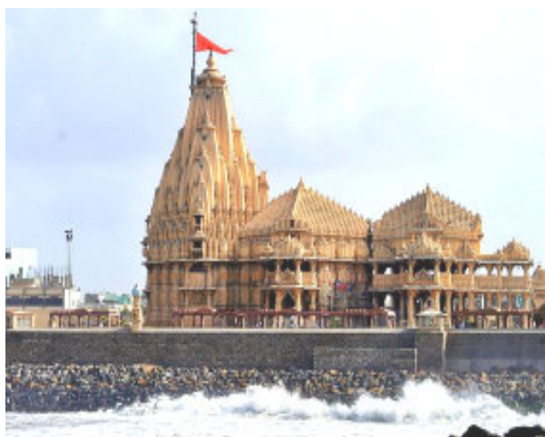
યાત્રિ સેવા અંદાજે જુન માસથી ગાઈડ સેન્ટર તેમજ આવાસ પ્રતિષ્ઠા વેઈટીંગ યાત્રિકોને સોમનાથ સંબંધીત નાની ફિલ્મ જોવા મળતી રહે તેવું એ.સી. ભુકીંગ પ્રતિષ્ઠા અધિકારીઓ આ સ્ટેશનો પર કાર્યરત છે.

(પ્રતિનિધિ દ્વારા) મુખ્ય મંદિરની આસપાસ ફરતા પ્રભાસ પાટણ તા. ૨૦ જ્યાં-જ્યાં આ સફેદ પટ્ટા ભારતના વિશ્વપ્રસિધ્ધ લાગેલ હશે તેની ઉપર ચાલવાથી સોમનાથ મહાદેવ મંદિર હાલ આકરી ગરમીમાં પછ પગ ચાલી રહેલ કાળઝાળ આકરી ધગતા નથી. આ ઉપરાંત ગરમી અને તકકાના તપાટથી સોમનાથ મહાદેવનું મંદિર એરકંપ્રેસ સિસ્ટમથી જડાયેલ છે આવતા યાત્રિકો અને જેથી મંદિરમાં દર્શન કરતી વખતે દર્શનાર્થીઓ ગરમી, તાપથી બહાર કરતા ૭ ડીગ્રી ઓછી હેરાન-પરેશાન ન થાય તે માટે ગરમી રહે છે. ન માત્ર એટલું જ સઘન પ્રયાસો સોમનાથ ટ્રસ્ટે પગોડા એટલે કે ગરમીમાં થાક હાથ ધર્યા છે. સોમનાથ ટ્રસ્ટના ઉતારવા મંદિર પરિસરમાં સચિવ અને જનરલ મેનેજરના લગાવાયા છે અને ત્રણથી ચાર માર્ગદર્શન મુજબ સમગ્ર જગ્યાએ પીવાના પાણીની સોમનાથ મંદિરના દર્શન પથ વિશેષ વ્યવસ્થાઓ કરાયેલી છે. અને મુળ મંદિરમાં જવાના તથા સોમનાથ મંદિર દેશ-બહાર નીકળવાના રસ્તા ઉપર વિદેશના યાત્રિકો-પ્રવાસીઓની શ્વેત કેમિકલનું લેપન કરાઈ રહ્યું સુવિધાઓ માટે હાલના મંદિર ઇ. આ કેમિકલ દર્શનાર્થીઓને અતિથી ગૃહની પાસે અદ્યતન યાત્રિ સેવા અંદાજે જુન માસથી ગાઈડ સેન્ટર તેમજ આવાસ પ્રતિષ્ઠા વેઈટીંગ યાત્રિકોને સોમનાથ સંબંધીત નાની ફિલ્મ જોવા મળતી રહે તેવું એ.સી. ભુકીંગ પ્રતિષ્ઠા એ.સી. ભુકીંગ પ્રતિષ્ઠા અધિકારીઓ આ સ્ટેશનો પર કાર્યરત છે.