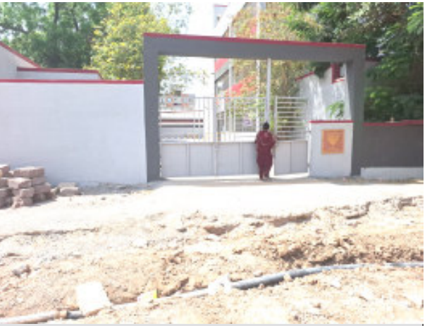
તાત્કાલીક રસ્તા રીપેરીંગની કામગીરી પૂર્ણ કરવા અથવા તો મતદાન મથકોને અન્યત્ર ફેરવવા માંગણી