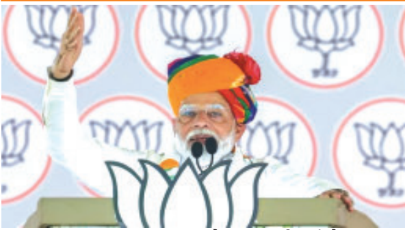
જૂનાગઢ તા.૨૪ વેંગવાન બની ગયું છે. ભારતના લોકસભાની ચુંટણીને લઈને રાજકીય પક્ષોનું પ્રચાર તંત્ર આગામી તા.૨ મેના રોજ