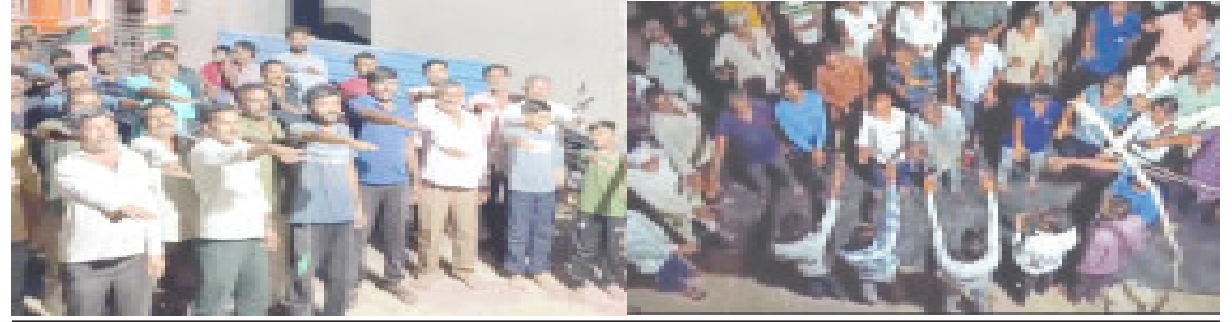
સુત્રાપાડામાં ક્ષત્રિય સમાજ દ્વારા ભાજપ વિરુદ્ધ મતદાનના શપથ લેવાયા

(રાકેશ પરડવા દ્વારા) ગીર સોમનાથ જિલ્લામાં પણ આ આંદોલનની અસર જોવા મળી રહી છે. જિલ્લાના ઉના અને સુત્રાપાડા તાલુકાના ગ્રામ્ય વિસ્તારોમાં ક્ષત્રિય સમાજના સમુદાય દ્વારા ભાજપ વિરુદ્ધ મતદાનના શપથ લેવામાં આવ્યા હતા. તો રૂપાલા હાય હાય... કમલ કા ફૂલ હમારી ભૂલ ના નારા પણ લગાવવામાં આવ્યા હતા. રાજકોટ લોકસભાના ઉમેદવાર પુરપોતમ રૂપાલા દ્વારા ક્ષત્રિય સમુદાય વિશે કરાયેલ વિવાદિત નિવેદનના કારણે ક્ષત્રિય સમાજમાં ઉઠેલો રોષ દિન પ્રતિદિન ઘેરો બની રહ્યો છે. પ્રથમ પુરપોતમ રૂપાલાની ઉમેદવારી પરત ખેંચાયની માંગ ન સંતોષાતા ક્ષત્રિય