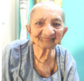
જૂનાગઢ તા.૨૯ ચૂંટણી પંચ દ્વારા વયોવૃદ્ધ એટલે કે, ૮૫ વર્ષથી વધુ ઉંમરના અને દિવ્યાંગ મતદારોને ઘર બેઠા

જૂનાગઢ તા.૨૯ જૂનાગઢમાં બાયપાસ રોડ પર આવેલ ડી માર્ટ મોલ ખાતે મોબાઈલ ફ્લેશલાઈટ ચાલુ રાખી તા. ૭મી મેએ અચૂક મતદાન કરવા માટે લોકો સંકલ્પ બદ્ધ થયા હતા. જિલ્લા ચૂંટણી અધિકારી અને કલેક્ટર શ્રી અનિલ કુમાર રાણાવસિયાના માર્ગદર્શનમાં મતદાન જાગૃતિ અર્થે જિલ્લાભરમાં રચનાત્મક કાર્યક્રમો યોજવામાં આવી રહ્યા છે. જેમાં મતદારો સહભાગી બની અચૂક અવશ્ય મતદાન કરવા માટે પ્રતિજ્ઞા કરી રહ્યા છે. જૂનાગઢના ડી માર્ટ મોલ ખાતે