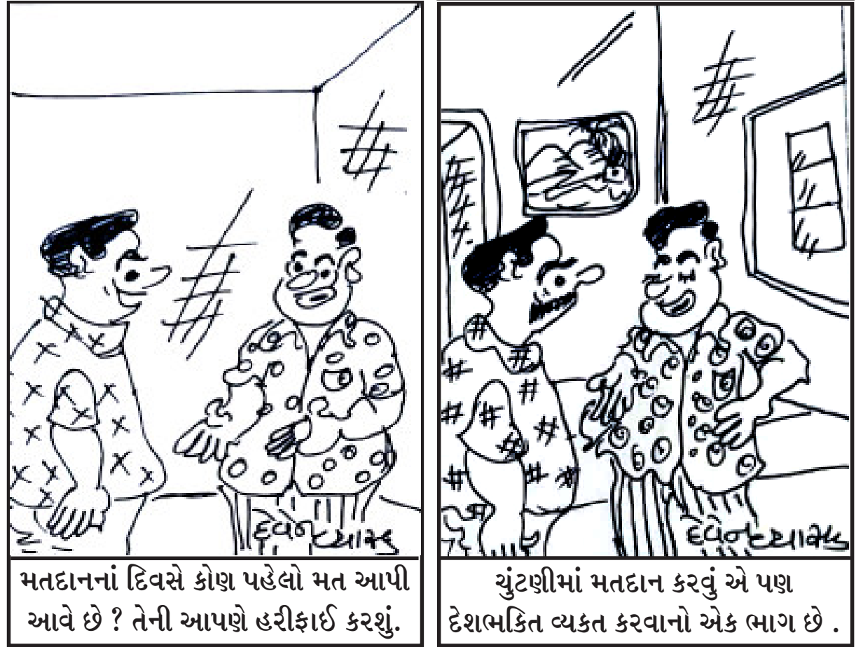
મતદાનનાં દિવસે કોણ પહેલો મત આપી આવે છે ? તેની આપણે હરીફાઈ કરશું. ચૂંટણીમાં મતદાન કરવું એ પણ દેશભક્તિ વ્યક્ત કરવાનો એક ભાગ છે .