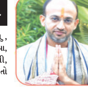
મહિલા મંડળના તમામ બહેનો છેલ્લા એકાદ માસથી જહેમત ઉઠાવી રહ્યા છે.