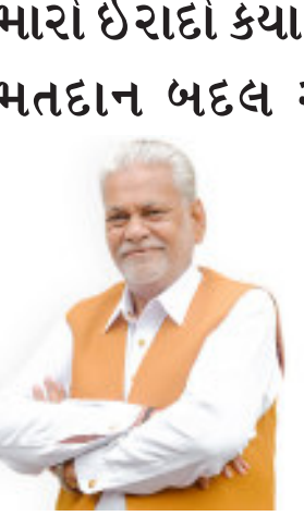
રાજકોટ, તા. ૮

રાજકોટ લોકસભાની પુરા રાજ્યમાં કેન્દ્રમાં રહેલી ચૂંટણીનું મતદાન ગઈકાલે પૂર્ણ થયું છે. ગત ચૂંટણી કરતા મતદાનમાં થોડો ઘટાડો થયો છે ત્યારે આજે