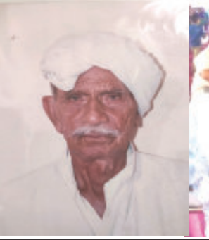
ખેડૂતોનાં મસીહા બની તત્કાલીન સરકાર સામે બંડ પોકારી ખેડૂતો પર લાદેલ લેવી કર નાબુદ કરાવ્યો