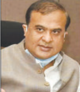
નવી દિલ્હી, તા. ૧૫: આસામના મુખ્યમંત્રી હિમંતા બિશ્વા સરમાએ પૂર્વ દિલ્હી લોકસભા પરથી

ભાજપના ઉમેદવાર હર્ષ મલ્હોત્રાના સમર્થનમાં આજે દિલ્હીની એક ચૂંટણી રેલીને સંબોધિત કરતા કહ્યું કે જો લોકસભા ચૂંટણીમાં ભાજપને ૪૦૦થી વધુ સીટો મળશે તો મથુરામાં ભવ્ય મંદિર બનાવવામાં આવશે. તેમણે એમ પણ કહ્યું કે કાશીમાં જ્ઞાનવાપીની જગ્યાએ એક ભવ્ય મંદિર બનાવવામાં આવશે. ચૂંટણી રેલીને સંબોધતા તેમણે કહ્યું કે દેશમાં મુઘલોએ અનેક કારનામા કર્યા છે. તેમાંથી ઘણાને હજુ સાક કરવાના બાકી છે. હિમંતાએ કહ્યું કે જ્યારે કોંગ્રેસ સત્તામાં હતી ત્યારે કહેવામાં આવતું હતું કે કાશ્મીર ભારતની સાથે સાથે પાકિસ્તાનમાં પણ છે અને સંસદમાં એવી કોઈ ચર્ચા નહોતી થઈ કે પાકિસ્તાન અધિકૃત કાશ્મીર પણ ભારતનું છે, પરંતુ છેલ્લા કેટલાક દિવસોથી પાકિસ્તાન અધિકૃત કાશ્મીરમાં પણ, લોકો ભારતીય ધ્વજ લઈને ફરતા જોવા મળે છે. તેમણે કહ્યું કે તે કબજો છે પરંતુ વાસ્તવમાં તે અમારો છે.