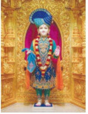
(પ્રતિનિધિ દ્વારા) દ્વારકા તા.૧૬ યાત્રાધામ દ્વારકામાં નાગેશ્વર રોડ ઉપર આવેલ શ્રી