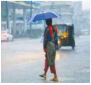
નવી દિલ્હી તા. ૧૬ આ વર્ષે ચોમાસું સામાન્ય