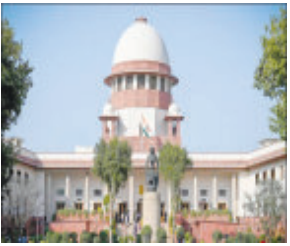
નવી દિલ્હી તા. ૩૧ : દેશની સર્વોચ્ચ અદાલતે સરકારી નોકરીમાં પ્રમોશનને લઈને મોટી વાત કહી છે. સુપ્રિમ કોર્ટે કહ્યું કે સરકારી કર્મચારીઓને પ્રમોશન આપવાના માપદંડનો બંધારણમાં ક્યાંય ઉલ્લેખ નથી. અદાલતે કહ્યું કે

સરકાર અને કાર્યપાલિકા પ્રમોશન માટેના માપદંડ નક્કી કરવા માટે સ્વતંત્ર છે. શ્રીક જસ્ટિસ ડીવાય ચંદ્રચુડ, જસ્ટિસ જેબી પારડીવાલા અને જસ્ટિસ મનોજ મિશ્રાની બેન્ચે પોતાના યુકાદામાં કહ્યું હતું કે, 'ભારતમાં કોઈ પણ સરકારી કર્મચારી પ્રમોશનને પોતાનો અધિકાર માની શકે નહીં, કારણ કે બંધારણમાં તેના માટે કોઈ માપદંડ નક્કી કરવામાં આવ્યા નથી.' કોર્ટે તેના યુકાદામાં કહ્યું હતું કે વિધાનસભા અથવા કાર્યપાલિકા