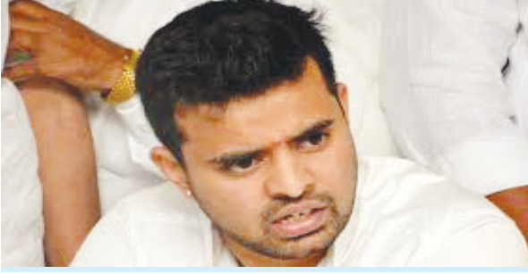
બેંગ્લુરુ તા. ૩૧ : સમગ્ર દેશમાં ભારે ચર્ચાસ્પદ બનેલા કર્ણાટક સેક્સ સ્કેન્ડલનો મુખ્ય આરોપી સાંસદ પ્રજ્વલ રેવન્ના જર્મનીથી ભારત પહોંચી ગયો છે. ફ્લાઈટ બેંગ્લુરુ એરપોર્ટ પર ઊતર્યા બાદ તરત જ SITએ તેને કસ્ટડીમાં લીધા હતા. પ્રજ્વલને અહીંથી SIT ઓફિસમાં લાવવામાં આવ્યા હતા મીડિયા રિપોર્ટ્સ અનુસાર, પ્રજ્વલની સૌથી પહેલા આજે પૂછપરછ થઈ રહી છે. આ પછી તેનો મેડિકલ ટેસ્ટ કરવામાં આવશે. પ્રજ્વલને મેજિસ્ટ્રેટ કોર્ટમાં પણ રજૂ કરવામાં આવશે. અહીં પોલીસ તેની કસ્ટડીની

માંગણી કરશે. આ સાથે ફોરેન્સિક ટીમ તેના ઓડિયો સેમ્પલ પણ લેશે, જેથી એ જાણી શકાય કે વાઈરલ સેક્સ વીડિયોમાં જે અવાજ આવી રહ્યો છે તે પ્રજ્વલનો છે કે નહીં. કર્ણાટક સેક્સ સ્કેન્ડલના મુખ્ય આરોપી સાંસદ પ્રજ્વલ રેવન્ના ૩૦-૩૧ મેની રાત્રે ૧ વાગ્યે જર્મનીથી ભારત પરત ફર્યા હતા. ન્યૂઝ એજન્સી પીટીઆઈના જણાવ્યા અનુસાર, તેણે જર્મનીના મ્યુનિકથી બેંગ્લોરની ફ્લાઈટમાં બિઝનેસ ક્લાસની ટિકિટ બુક કરાવી હતી. એરપોર્ટ પર પણ સુરક્ષા વધારી દેવામાં આવી હતી. પ્રજ્વલ રેવન્ના સામે અત્યાર સુધીમાં