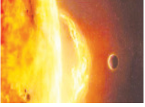
નવી દિલ્હી, તા. ૩૧ સમગ્ર દેશ સાથે ગરમીનું ભયંકર મોજુ ઉત્તર ભારતમાં ફરી વળ્યું છે. ભીષણ ગરમીના કારણે હવે સુરજનો તાપ જીવલેણ બનતો

હોય તેમ ગઈકાલે ગુરૂવારે માત્ર એક જ દિવસમાં ઉત્તરપ્રદેશમાં ૧૬૪ અને બિહારમાં ૬૦ સહિત કુલ ૨૨૭ લોકોના મોત થયા છે. તો દિલ્હીમાં પણ પહેલું મૃત્યુ નોંધાયું છે. ગઈકાલે પંજાબનું ફરીદકોટ અને રાજસ્થાનનું શ્રીગંગાનગર સમગ્ર દેશમાં સૌથી ગરમ શહેર રહ્યા હતા અને તાપમાન ૪૮.૩ ડિગ્રી હતું યુપીના બુલંદ શહેરમાં ૪૮, દિલ્હીમાં