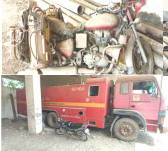
(પ્રતિનિધિ દ્વારા) માણવાદર તા. ૧ માણવાદર પાલીકામાં છેલ્લા બબ્બે વર્ષથી ફાયર ફાઈટર વાહનો કોના પાપે બંધ છે ? તે યજ્ઞ પ્રશ્ન ઉદભવ્યો છે. માણવાદર

શહેરમાં કાલા કપાસ જેવા વિસ્ફોટક કહી શકાય તેવા ઝડપથી આગ લાગે તેવા અને કિંમતી ગણી શકાય તેવા જીનીંગ ઉદ્યોગ મુખ્ય વ્યવસાય છે. ત્યારે બબ્બે ફાયર ફાઈટર તથા એક બુલેટ અગ્નિશામક તરીકે પાલીકાને સરકાર તરફથી મળેલ તે કોના પાપે ધુળ ખાઈ રહ્યા છે ? તે ઉચ્ચકક્ષાની તપાસનો વિષય છે. બીજી બાજુ જઈબી પાછળ ઉભા થયેલા એપાર્ટમેન્ટ ઉંચા બાંધી દીધા છે તેની મંજૂરી છે કે કેમ ? તાજેતરમાં રાજકોટનાં બનેલા બનાવથી શહેરમાં પણ ઉચી બિલ્ડીંગો રહેનારાના પેટમાં ફાળ પડી છે કે આગ લાગે તો શું થાય ? તેવું આમ જનતામાં માં ચર્ચાઈ રહ્યું છે.