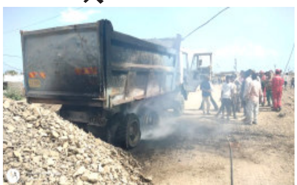
ટ્રક (ટોરસ)નું ઠાકું ઊંચું કર્યું હતું. ત્યારે આ ટ્રકની ઉપરથી પસાર થઈ રહેલા જીવંત વીજ વાયરને આ ટ્રકનો ઉપરનો ભાગ અટકી

(પ્રતિનિધી દ્વારા) જામ ખંભાળિયા, તા.૭ ખંભાળિયા નજીકના સલાયા વિસ્તારમાં ગુરુવારે સવારે રેતી ભરેલા એક ટ્રકમાં જીવંત વીજ વાયરના કારણે આગજની સર્જાઈ હતી. આ સમગ્ર પ્રકરણની સૂત્રો દ્વારા જાણવા મળતી વિગત મુજબ ખંભાળિયા તાલુકાના સલાયા વિસ્તારમાં આવેલા રેલવે સ્ટેશન નજીક એક ટ્રકના ચાલકે પોતાના ટ્રક (ટોરસ)માં રહેલી રેતીને ખાલી કરવા માટે