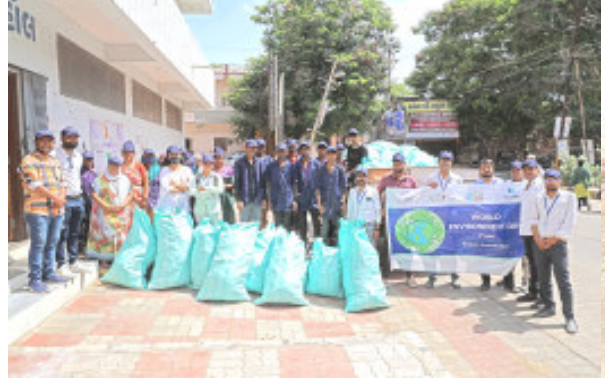
(પ્રતિનિધી દ્વારા) જામ ખંભાળિયા, તા.૭ પ્રોજેક્ટ સ્વચ્છ હાલાર અંતર્ગત તાજેતરમાં ફિનિશ સોસાયટી, સી.ટી.એસ., હું અને ખંભાળિયા

નગરપાલિકાની ટીમના સંયુક્ત ઉપક્રમે ખંભાળિયામાં વિશ્વ પર્યાવરણ દિવસની ઉજવણી કરવામાં આવી હતી. જેમાં સ્વચ્છતા કાર્યક્રમનું અયોજન કરવામાં આવ્યું હતું.