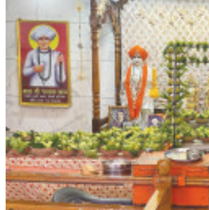
(પ્રતિનિધી દ્વારા) જામ ખંભાળિયા તા.૭ ખંભાળિયાના જોધપુર ગેઈટ વિસ્તારમાં આવેલા સુવિખ્યાત

જલારામ મંદિર ખાતે દર વર્ષની જેમ આ વર્ષે પણ આંબા મનોરથના દર્શનનું ભવ્ય આયોજન કરવામાં આવ્યું હતું.