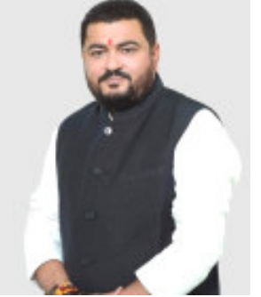
કરવામાં આવી છે. આ રેલ્વે સ્ટોપથી રેલ્વેની આવકમાં વધારો થશે. મુસાફરો વધુમાં વધુ રેલ્વેની સેવાનો લાભ મેળવી શકશે.