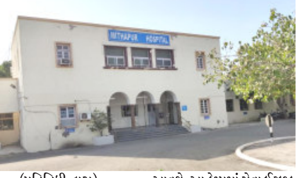
(પ્રતિનિધી દ્વારા) આવશે. આ કેમ્પમાં સેવા ઈચ્છુક દર્દીઓ માટે સવારે ૭.૩૦ વાગે રજિસ્ટ્રેશન શરુ થશે. ઓખામંડળનાં લોકોને આ કેમ્પનો લાભ લેવા જણાવવાયું છે.

મીઠાપુર હોસ્પિટલ ખાતે ટાટા કેમિકલ્સ દ્વારા વિનામૂલ્યે હેલ્થ કેમ્પનું આયોજન (પ્રતિનિધી દ્વારા) દ્વારકા તા.૧૫ આગામી ૧૬ જુનને રવિવારે સવારે ૮ થી ૨ વાગ્યા સુધી ટાટા કેમિકલ્સ દ્વારા આરોગ્ય કેમ્પનું આયોજન કરાયું છે. આ કેમ્પમાં ફીઝીશિયન અને સજ્જન ડોક્ટરો દ્વારા વિનામૂલ્યે જનરલ ચેકઅપ કરવામાં આવશે અને એક્સપર્ટ ઓન્કોલોજિસ્ટ તેમજ કાર્ડિયોલોજિસ્ટ દ્વારા સ્પેશિયલાઈઝ્ડ ચેકઅપ તથા રોસ્ટ્રલની સુવિધાઓ, મેડિકલ ડિવાઈસિસ અને તેને સંબંધિત ઈન્સ્ટ્રુમેન્ટ્સની ફુલ એક્સેસ અને કન્સલ્ટેશન પુરા પાડવામાં