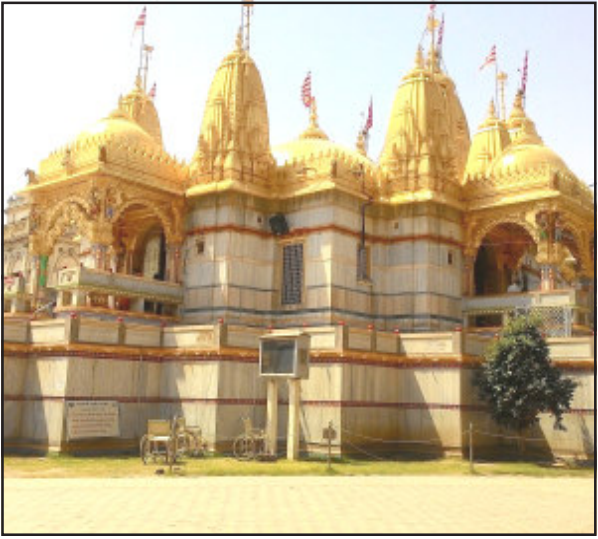
નડિયાદ, તા. ૧૫ સિદ્ધાંત રક્ષક સમિતિના નેજા વડતાલ સ્વામિનારાયણ હેઠળ સુરત, ગઢડા, રાજકોટ, સંપ્રદાયના ત્રણ સ્વામી વિરુદ્ધ મુંબઈ, અમદાવાદ, જૂનાગઢ, વડોદરા ખાતે દુષ્કર્મની ફરિયાદ ભાવનગર, ભરૂચ સહિત તેમજ તેમજ ગઢડામાં સુષ્ટી સ્થળોથી આજે વડતાલ વિરુદ્ધનાં કાર્યો સહિતની હરિભક્તો આવી યજ્ઞ હતા બાબતોને લઈને સ્વામિનારાયણ અને મંદિર પરિષદમાં ઉગ્ર

વડતાલ ટેમ્પલ બોર્ડના ચેરમેન સહિતના અગ્રણીઓ પહેલાં જ રવાના થઈ ગયા : આવેદનપત્ર પાઠવી અપાઈ ચીમકી