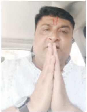
(રાકેશ પરડવા દ્વારા) આવી રહ્યો છે. દરમ્યાન ગીર સોમનાથમાં આભાર દર્શનના એક કાર્યક્રમમાં જૂનાગઢનાં સાંસદે જાહેર મંચ પર થી કહ્યું હતું કે, ભાજપ હિસાબ કરે કે ના કરે...

જિલ્લા પોલીસવાડાને પત્ર લખીને પોતાને ડર લાગી રહ્યો હોય કાર્યવાહી કરવાની માંગણી કરી