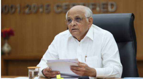
(પ્રતિનિધિ દ્વારા) રસ્તાઓના રિસરફેસીંગ તથા ગાંધીનગર તા.૨૩ મુખ્યમંત્રી ભૂપેન્દ્ર પટેલે ૨૦૨૩-૨૪ સુધીમાં ૮૧૦.૯૫ કરોડ રૂપિયા રાજ્ય સરકારે ફાળવ્યા

યોમાસુ પૂરૂ થાય એટલે ત્વરાએ રસ્તા મરામત કામો નગર પાલિકાઓ શરૂ કરી શકે તે માટે એડવાન્સમાં નાણાં ફાળવણી કરવાનો મુખ્યમંત્રીનો અભિગમ : સ્વર્ણિમ જયંતિ મુખ્યમંત્રી શહેરી વિકાસ યોજનામાંથી મુખ્યમંત્રી શહેરી સડક યોજના અન્વયે ૧૫૭ નગરપાલિકાઓને મળશે ગ્રાન્ટ : મુખ્યમંત્રી શહેરી સડક યોજના માટે ૨૦૨૩-૨૪ સુધીમાં ૮૧૦.૯૫ કરોડ રૂપિયા રાજ્ય સરકારે ફાળવ્યા