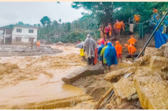
વાયનાડ, તા. ૩૧ ભૂસ્ખલનમાં અનેક ગામડા સાફ કેરળના વાયનાડમાં ભયાનક થઈ ગયા છે અને મૃત્યુઆંક ૧૫૮