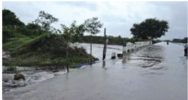
(પ્રતિનિધિ દ્વારા) દ્રશ્યો જોવા મળ્યા હતા. જામ જામ ખંભાળિયા તા.૩૧ કલ્યાણપુર તાલુકામાં આ વર્ષે ભારે વરસાદ વરસ્યો છે. જેમાં ખાસ કરીને રાવલ વિસ્તારમાં પડેલા નોંધપાત્ર વરસાદથી ઠેર-ઠેર તારાજના

કલ્યાણપુર વચ્ચેના રસ્તા ઉપર ગોઠણબુડ પાણી જોવા મળ્યા હતા. તાલુકાના પાનેલી-કલ્યાણપુર-સૂર્યાવદર ગામે ઉપરવાસના વિસ્તારોમાં વરસાદી પાણીની વિપુલ આવક સાની ડેમમાં ચાલુ હોવાથી ડાલ પાલી રાખવામાં આવેલા સાની ડેમના પાણીનો પ્રવાહ સતત વધતો જોવા મળ્યો હતો. જે સૂર્યાવદર પાસેના પુલ ઉપરથી વહેતા પાણીથી અવર-જવર ઉપરના માર્ગ ઉપર પૂર જેવા પાણી વહેતા હોવાથી આ વિસ્તારમાં અવરજવર માટે લોકોને હાલાકીનો સામનો કરવો પડ્યો હતો.