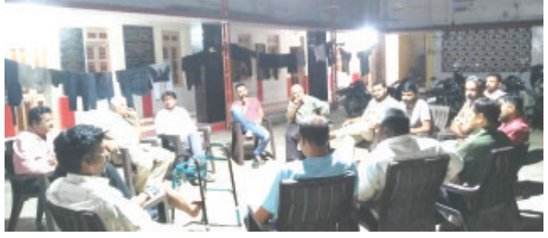
જૂનાગઢ તા.૩૧ આગામી તા.૧૯ને સોમવારના રોજ રક્ષાબંધન બળેવ પર્વ હોય જેની ઉજવણીના ભાગરૂપે રાજગોર બ્રાહ્મણ યુવક મંડળ દ્વારા પ્રતિવર્ષની જેમ આ વર્ષે પણ રાજગોર બ્રાહ્મણ વિદ્યાર્થી ભુવન ગાંધીગ્રામ ખાતે બપોરે ૧૨ કલાકે સમુહ ભોજનનું આયોજન કરાયું છે. જેમાં