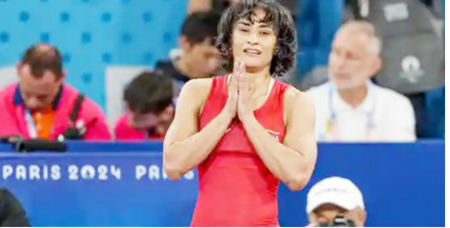
વિનેશ ફોગટને પેરિસ ૨૦૨૪ ઓલિમ્પિક્સમાં ગોલ્ડ મેડલ માટેના ફાઈનલ મુકાબલા પુર્વે જાહેરાત કરવામાં આવી હતી જેના પગલે તે ભાંગી પડી હતી અને ડીહાઈડ્રેશનની અસર હેઠળ સારવાર માટે હોસ્પિટલમાં ખસેડવામાં આવી હતી.

ઓલિમ્પિકમાં ફાઈનલ પુર્વે જ વધુ વજનના કારણે અયોગ્ય જાહેર થયેલી વિનેશ ફોગટે આજે સવારે ૫.૧૭ કલાકે ટવીટ પોષ્ટમાં નિવૃત્તિ લેવાની જાહેરાત કરી હતી. ટવીટમાં વિનેશે લખ્યું કે 'મા, કુસ્તી મારાથી જીતી ગઈ, હું હારી ગઈ. માફ કરજો આપનું સ્વપ્ન, મારી હિંમત બંધું તૂટી ગયું. હવે વધુ તાકાત રહી નથી.'