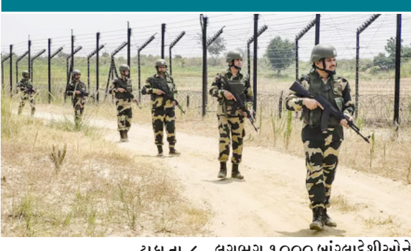
બાકા તા. ૮ : ભારત-બાંગ્લાદેશ સરહદે જલપાઈ ગુડી નજીક BSF નજીક ઘુસણખોરી કરી રહેલા જવાનોએ રોકથા હતા. નોર્થ બંગાળ

ક્રિટિયરના જણાવ્યા અનુસાર, આ લોકો બાંગ્લાદેશમાં પ્રદર્શનકારીઓના હુમલાના ડરથી એકઠા થયા હતા. BSF અને બોર્ડર ગાર્ડ બાંગ્લાદેશે આ લોકો સાથે વાત કરી, ત્યારબાદ તેઓ બધા પાછા ફર્યા. બાંગ્લાદેશ સાથેની આંતરરાષ્ટ્રીય સરહદ પર BSF હાઈ એલર્ટ પર છે. બીજી તરફ શેખ હસીનાના રાજીનામા બાદ આજે બાંગ્લાદેશમાં વચગાળાની સરકાર રચાશે. આ ૧૫ સભ્યોની સરકારનું નેતૃત્વ નોબેલ પુરસ્કાર વિજેતા મુહમ્મદ યુનુસ કરશે. સરકારનો શપથ ગ્રહણ સમારોહ રાત્રે ૮:૩૦ વાગે થશે. યુનુસ આજે બપોરે ૨.૪૦ કલાકે પેરિસથી બાંગ્લાદેશ પહોંચશે. ઢાકા ટ્રિબ્યુન અનુસાર, લગભગ ૪૦૦ લોકો શપથ સમારોહમાં ભાગ લેશે. બાંગ્લાદેશના આર્મી ચીફ વકાર-ઉલ-હકમને શપથ ગ્રહણ સંબંધિત માહિતી જણાવી હતી.