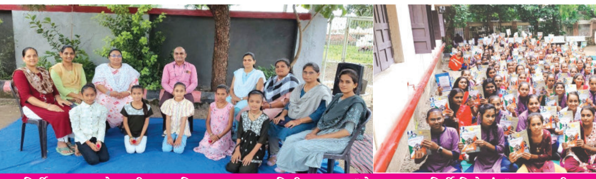
કારકિર્દી ઘડતર માટે યાવૃરૂપ ભૂમિકા ભજવતા માહિતી ખાતાના "રોજગાર કારકિર્દી વિશેષાંક" પ્રકાશનની અગત્યતા વિશે સમજ પૂરી પાડી