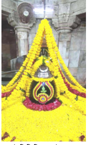
(પ્રતિનિધિ દ્વારા) પ્રભાસ પાટણ તા. ૧૩ ઈન્દોરના મહારાણી અહલ્યાબાઈ હોલકરની પુણ્યતિથી આજે તા. ૧૩ ઓગસ્ટ ને મંગળવારના રોજ હોય ત્યારે યાદ કરીએ તેના સોમનાથ સાથેના પુણ્ય

સોમનાથ મંદિર ૧૮ મી સદીમાં જ્યારે જીર્ણ અવથામાં હતું ત્યારે તિર્થમાં શિવપૂજાને અખંડ રાખવા મહારાણી અહલ્યાબાઈએ મંદિરનું નિર્માણ કરાવેલ