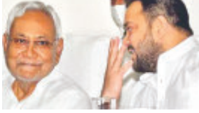
પટના, તા. ૪ : દેશમાં સત્તા પડતા માટે જાણીતા બનેલા બિહારમાં ફરી એક વખત રાજકીય ગતિવિધિ યાલુ થતા જ

સપ્તેન્સ વધ્યું છે. ભાજપ અને આરજેડી સાથે વારાફરતી સત્તા ભોગવનાર રાજ્યના મુખ્યમંત્રી નીતિશકુમાર અને આરજેડીના વડા તેજસ્વી યાદવની મુલાકાતથી રાજ્યમાં શું જનતા દળ(યુ) અને આરજેડી ફરી સાથે આવશે તે અંગે પણ ચર્ચા જાગી છે. જોકે હાલમાં જ મુખ્યમંત્રી નીતિશકુમાર અને વિપક્ષના નેતા તેજસ્વી યાદવ વચ્ચે મળેલી બેઠક અંગે બહાર આવતી વિગત મુજબ રાજ્યમાં નવા માહિતી કમિશનરની નિયુક્તિમાં વિપક્ષના નેતાની હાજરી જરૂરી હોવાથી આ બેઠક મળી હતી અને તેમાં નામોની સંભવિત ચર્ચા થઈ છે. જોકે જે રીતે નીતિશકુમારે રાજદના વડા તેજસ્વી યાદવ સાથે ઉપ્ખાભરી બેઠક કરી તેથી ભાજપના ભવા ઉચકાયા છે. એક તરફ તેજસ્વી અને નીતિશની બેઠક અને બીજી તરફ લાલુપ્રસાદ યાદવે પણ પક્ષના ધારાસભ્યની બેઠક બોલાવી હતી તેમાં વિધાન પરિષદના સભ્યો અને ચૂંટણી હારેલા સાંસદો અને ધારાસભ્યોને પણ બોલાવ્યા હતા. આમ લાલુપ્રસાદની આ બેઠક અંગે પણ ક્યાસ કાઢવા પ્રયત્ન થઈ