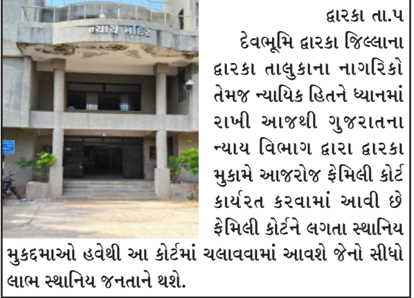
મુકદ્દમાઓ હવેથી આ કોર્ટમાં ચલાવવામાં આવશે જેનો સીધો લાભ સ્થાનિય જનતાને થશે.