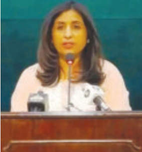
નવી દિલ્હી તા. ૬ વિશ્વભરમાં આતંકવાદને પ્રોત્સાહન આપવા જાણીતું પાકિસ્તાન જૂનાગઢને લઈને