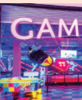
ગાંધીનગર, તા. ૬ મુખ્યમંત્રી ભુપેન્દ્ર પટેલે ગેમીંગ એક્ટિવિટીનાં સંદર્ભમાં જાહેર સલામતી માટે મહત્વના નિર્ણય કર્યા

મુખ્યમંત્રી ભુપેન્દ્ર પટેલે ગેમીંગ એક્ટિવિટીનાં સંદર્ભમાં જાહેર સલામતી માટે મહત્વના નિર્ણય કર્યા. ગેમીંગ એક્ટિવિટી એરિયા અને કોમર્શિયલ બાંધકામમાં થતા ગેમીંગ એક્ટિવિટી એરિયા માટે અલગ અલગ પ્લાનીંગ રેગ્યુલેશનની જોગવાઈઓ CGDCRમાં કરવાના જનહિતલક્ષી નિર્ણય કર્યા છે. ગેમીંગ એક્ટિવિટી એરિયા અને કોમર્શિયલ બાંધકામમાં થતા ગેમીંગ એક્ટિવિટી એરિયા માટે અલગ અલગ પ્લાનીંગ રેગ્યુલેશનની જોગવાઈઓ કરવામાં આવી છે. CGDCRમાં આ અંગેની જે જોગવાઈઓ કરી છે તેમાં ગેમીંગ એક્ટિવિટી એરિયાના બાંધકામ માટે રસ્તાની પહોળાઈ, મિનિમમ એરિયા, બાંધકામની ઊંચાઈ, પાર્કિંગ, સલામતીના ઉપાયો તથા લેવાની થતી વિવિધ પ્રકારની NOCની વિસ્તૃત જોગવાઈઓનો સમાવેશ થાય છે. એટલું જ નહિ, સ્વતંત્ર ગેમીંગ એક્ટિવિટી માટેના પ્લોટમાં જાહેર સલામતીને ધ્યાને રાખીને અલગ અલગ એન્ટ્રી તથા એક્ઝિટ, ઈમરજન્સી એક્ઝિટ અને રેફ્યુજ એરિયાની જોગવાઈઓ પણ કરવામાં આવી છે. ગેમીંગ ઝોન એક્ટિવિટીના સ્થળે BU સર્ટિફિકેટ, ફાયર NOC તથા અન્ય તમામ લાયસન્સ, સર્ટિફિકેટ, NOC, પરમિટ વગેરે પ્રદર્શિત કરવાના રહેશે એવું પણ સ્પષ્ટ કરવામાં આવ્યું છે.