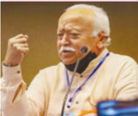
પુણે તા. ૬ રાષ્ટ્રીય સ્વયંસેવક સંઘ (આરએસએસ)ના વડા મોહન ભાગવતે આજે જણાવ્યું હતું કે, મણિપુરમાં સ્થિતિ હજુ પણ મુશ્કેલ

છે. સ્થાનિક લોકો તેમની સુરક્ષાને લઈને ચિંતિત છે. જે લોકો ત્યાં વેપાર કે સામાજિક સેવા માટે જાય છે તેમના માટે વાતાવરણ વધુ પડકારજનક છે. તેમણે કહ્યું- આ બધું હોવા છતાં, સંઘ કાર્યકર્તાઓ બંને જૂથો (કુકી અને મેટેઈ) ને મદદ કરવા અને વાતાવરણને સામાન્ય બનાવવાનો પ્રયાસ કરી રહ્યા છે. કામદારો ન તો ત્યાંથી ભાગ્યા કે ન તો નિષ્ક્રિય બેસી રહ્યા. તેઓ