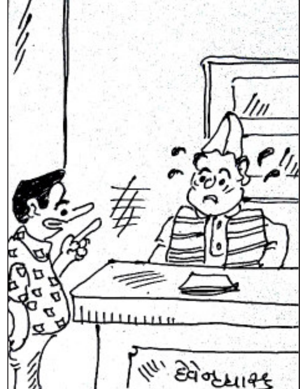
ખરેખર તો દેશના નેતાઓનો ગુણોત્સવ યોજવો જોઈએ !