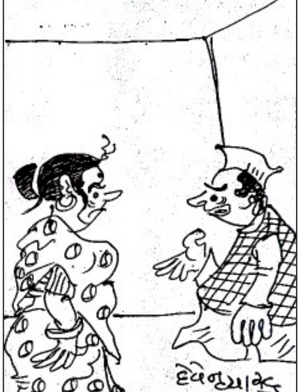
બહાર વિરોધ પક્ષ વાળા મારો વિરોધ કરે છે અને ઘરમાં તું !