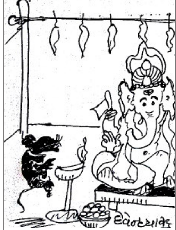
આ ભેળસેળીયા ઘી વાળા લાડુ ન આરોગતા પ્રભુ, આરોગ્યની સમસ્યા થશે !