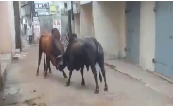
(પ્રતિનિધિ દ્વારા) ભટકતાં પશુઓથી શહેરીજનો કેશોદ તા.૧૦ ત્રાહિમામ પોકારી ઉઠ્યા છે. કેશોદ શહેરમાં ૨૫૩તાં નામદાર હાઈકોર્ટ દ્વારા

જવાબદાર તંત્રને ફટકાર લગાવી હતી ત્યારે પગલાં ભરવાની અને પશુ માલિકો વિરૂધ્ધ કડકાઈથી કાર્યવાહી કરવાની મસમોટી જાહેરાત કરી સંતોષ માનનારા પદાધિકારીઓ અને અધિકારીઓ દ્વારા કોઈ કાર્યવાહી કરવામાં આવી નથી. કેશોદના જુના ગામતળ વિસ્તારમાં આવેલી જુની મેઈન બજારમાં જવાહર ચોક વિસ્તારમાં આખલાઓની લડાઈ વચ્ચે સમગ્ર બજારમાં સોપો પડી ગયો હતો અને પોતાના જાનમાલને બચાવવા ફટાફટ દુકાનો બંધ કરી દેવા મજબુર બન્યાં હતાં. કેશોદના જુના ગામતળ વિસ્તારમાં એક તો સાંકળા રસ્તાઓ અને સાંકળી શેરીઓ આવેલી છે ત્યારે રખડતાં ભટકતાં પશુઓથી રહીશો વેપારીઓ ત્રાહિમામ પોકારી ગયા છે. કેશોદની જુની બજારમાં આખલાઓની લડાઈ શરૂ થતાં કોઈ રીતે છુટા પડતાં ન હતાં ત્યારે સદનસીબે ડોર ટુ ડોર કચરો એકઠો કરતાં વાહન દ્વારા વચ્ચે પડી છુટા પાડતાં વેપારીઓ વાહનચાલકોએ હાથકારો લીધો હતો.