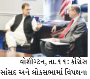
વોશિંગ્ટન, તા. ૧૧ : કોંગ્રેસ સાંસદ અને લોકસભામાં વિપક્ષના

નેતા રાહુલ ગાંધી હાલમાં અમેરિકાના પ્રવાસે છે અને તેઓ ત્યાંથી પણ ભાજપ અને મોદી સરકાર પર આક્રમક પ્રહાર કરી રહ્યા છે. રાહુલે કહ્યું કે ચીને લદાખમાં એક દિલ્હી જેટલી જમીન પચાવી પાડી છે ત્યારે કેન્દ્રમાં સત્તાધારી ભાજપ