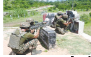
જમ્મુ તા. ૧૧ : પાકિસ્તાની સૈનિકોએ જમ્મુ અને કાશ્મીરના અખનૂરમાં સરહદ પર ગત મધ્યરાત્રીનાં ૨.૪૫ કલાકે યુદ્ધવિરામનું ઉલ્લંઘન કર્યું જવાબમાં બીએસએફના જવાનોએ પણ

ગોળીબાર કર્યો હતો. આ ફાયરિંગમાં બીએસએફનો એક જવાન ઘાયલ થયો છે. બીએસએફના પ્રવક્તાએ કહ્યું કે જવાબી કાર્યવાહીમાં પાકિસ્તાનને કેટલું નુકસાન થયું તે હજુ જાણી શકાયું નથી. આ ઘટના બાદ બીએસએફના જવાનો સરહદ પર કડક ચાંપતી નજર રાખી રહ્યા છે. જમ્મુ-કાશ્મીરમાં ૧૮ સપ્ટેમ્બરે યોજાનાર પ્રથમ તબક્કાના મતદાનના ૭ દિવસ પહેલા