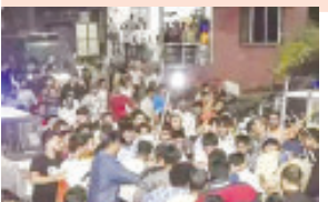
ભરૂચ તા. ૧૧ :

સુરતમાં ગણેશ પંડાલ પર પથ્થરમારોની ઘટના બાદ વધુ એક કોમી ઘર્ષણના અહેવાલો છે. આ વખતે ભરૂચમાં બે સમુદાયના લોકો વચ્ચે મોડી રાત્રે અથડામણ થઈ હતી. ઉલ્લંઘનનીય છે કે આવનારા