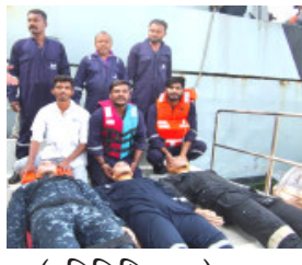
(પ્રતિનિધિ દ્વારા) જામ ખંભાળિયા તા.૨૭ નેશનલ મેરીટાઈમ સર્ય એન્ડ રેસ્ક્યુ બોર્ડના ઉપક્રમે મંગળવારે રાજ્યના છેવાડાના

જિલ્લા દેવભૂમિ દ્વારકા નજીકના ઓખા ખાતે રાજ્ય કક્ષાની મેરીટાઈમ સર્ય એન્ડ રેસ્ક્યુ (એ.સ.એ.આર.) વર્કશોપનું આયોજન કરવામાં આવ્યું હતું. જેમાં ૧૦૮ બોટ એમ્બ્યુલન્સ દ્વારા મોકલીલ યોજાઈ હતી. આ વર્કશોપમાં ભાગ લઈ અને લોકોને ૧૦૮ બોટ એમ્બ્યુલન્સ વિશે માર્ગદર્શન આપીને જાગૃત કરવામાં આવ્યા હતા.