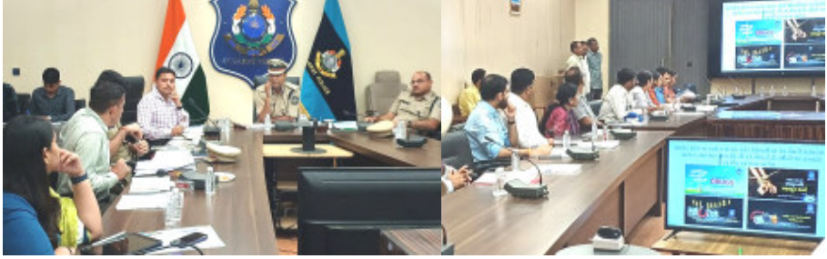
કોલેજ - યુનિવર્સિટી વિસ્તારમાં દુકાનો પર વોચ રાખવા, ખાસ કોમ્બિંગ કરવા સૂચના

(પંકજ ઝીબા દ્વારા) બગડિયાએ યુવા ધનને ડ્રગ્સથી બચાવવા માટે ડ્રગ્સના મૂળ એવા સિન્થેટિક ડ્રગ્સ અને ગાંજાના ઉત્પાદન પર ચાંપતી નજર રાખવા, તેમજ ડ્રગ્સના રેકેટને તોડવા, ડ્રગ્સ ગુજરાત રાજ્યમાં જે રસ્તેથી પ્રવેશે તે વિસ્તારમાં કોમ્બિંગ વધારવા તેમજ ડ્રગ્સ વિરોધી પ્રવૃત્તિને સપ્ત હાથે ડામી દેવા વિવિધ યુનિવર્સિટી-કોલેજ પર ચાંપતી નજર રાખવા પોલીસ કમિશ્નર મહેન્દ્ર બગડિયાએ નાર્કો કો-ઓર્ડિનેટર સેન્ટર (નાર્કોડ)ની બેઠકમાં ખાસ સૂચના આપી હતી. રાજ્ય સરકાર ડ્રગ્સના દુષ્પણ સામનો ટોલરન્સ પોલિસી સાથે ગંભીરતાપૂર્વક ડ્રગ્સ વિરોધી પ્રવૃત્તિને સપ્ત હાથે ડામી દેવા કટિબદ્ધ છે, ત્યારે રાજકોટમાં પણ ડ્રગ્સ વિરોધી પ્રવૃત્તિ અટકાવવા જે.સી.પી. મહેન્દ્ર