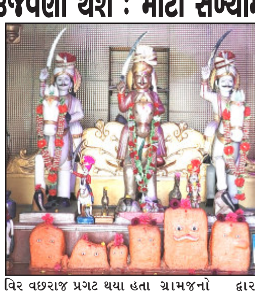
વિર વહરાજ પ્રગટ થયા હતા અને અહીં જ અસુરને હણીને ચારણની દીકરીની રક્ષા કરી હતી. જે કરમઈબાઈ પ્રગટ થયેલા વહરાજને અહીં બેહ ગામમાં જ રહી ગામનું રક્ષણ કરવાનું કહી, પોતે સમાધિ રૂપે સમાઈ ગયા હતા. ત્યારથી જ વીર વહરાજ જુગીવારાના નામથી બેહ ગામે પ્રજ્વલિત થયા છે. આ અંગે ગામના વડવાઓના જણાવ્યા મુજબ આશરે ૨૦૦ વર્ષ પહેલા જામનગર સ્ટેટ તરીકે ઓળખાતા જામસાહેબ દ્વારા સ્ટેટનો બાકી આકાર (કર) માટે વસૂલાવવાનું નક્કી કરવામાં આવ્યું હતું. જેમાં બેહ ગામનો કર બાકી હોવાથી કર ભરવાની મુદત પૂરી થઈ જતા ખાલસા કરવાનો હુકમ જામનગરના સ્ટેટ કર્યો હતો. જેથી ગ્રામજનો દ્વારા વિર વહરાજભાઈની ડેરીએ પ્રાર્થના કરી અને આગેવાનોએ થોડો-ઘણો કર લઈ જામ સ્ટેટના બંગલે પહોંચ્યા ત્યારે જામ સ્ટેટ દ્વારા જણાવવામાં આવ્યું હતું કે બેહ ગામનો કર ભરાઈ ગયો છે. ત્યારે ગામના લોકોનો આ બાબતે પૂછવામાં આવતા જણાવ્યું હતું કે કોઈ ઘોડેસવાર વ્યક્તિ આવીને કર ભરી ગયા છે. જેથી ગામના આગેવાનોએ કહ્યું હતું કે જુગીવારા વાઘરાભાઈએ કર ભર્યો છે. હાલ અહીં જુગીવારા વાઘરાભાઈનું ભવ્ય મંદિર વસૂલાવ કરવામાં આવ્યું છે. બેહ ગામના આગેવાનો દ્વારા જણાવ્યા મુજબ જુગીવારા વાઘરાભાઈના મંદિર પ્રત્યે તડમાર તેયારીઓ ચાલી રહી છે.

(પ્રતિનિધિ દ્વારા) જામ ખંભાળિયા, તા.૫ ખંભાળિયા નજીક આવેલા વિખ્યાત જુગીવારા ધામ ખાતે દર વર્ષે જાતરની ભવ્ય ઉજવણીનું આયોજન કરવામાં આવે છે. જેમાં સૌરાષ્ટ્રભરમાંથી અદારેચ વર્ણના લોકો દર્શનાર્થે આવે છે. ખંભાળિયા-દારકા ધોરીમાર્ગ પર અત્રેથી આશરે ૩૦ કિલોમીટર દૂર બેહ ગામના પાટીયાથી ૯ કી.મી. દૂર આવેલા સુપ્રસિદ્ધ જુગીવારા ધામ ખાતે નવરાત્રિના પ્રથમ સોમવારે તા. ૭ ના રોજ જુગીવારા વાઘરાભાઈના મંદિરે જાતરનું સુંદર આયોજન કરવામાં આવ્યું છે. દર વર્ષની જેમ આ વર્ષે પણ હજારોની સંખ્યામાં માનવ મહેરામણ સૌરાષ્ટ્રભરમાંથી અહીં દર્શનાર્થે ઉમટી પડશે. આ ધાર્મિક સ્થળનો ઇતિહાસ પણ આટલો જ ભવ્ય છે. આશરે પાંચસો વર્ષ પહેલા બેહ ગામે આવેલ જુગી નામના જંગલમાં રાક્ષસ રહેતો હતો. તે રાક્ષસ ગામ લોકોને પરેશાન કરતો હતો. તે વખતે ચારણની દીકરી કરમઈબાઈ ભાણી લઈને પસાર થતા આ અસુરે ક્રુદ્ધિ કરતા કરમઈબાઈ સાક્ષાત ધરાઅંબા શક્તિનો અવતાર હોવાથી તેમણે વીર વહરાજને સમરણ કરતા જ