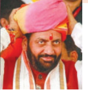
નેશનલ કોન્ફરન્સનાં વડા ઉમર અબ્દુલ્લાએ આજે મીડીયા સમક્ષ વાતચીત કરતા એવું જણાવ્યું હતું