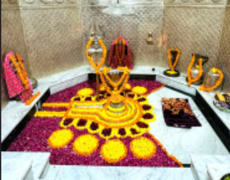
(પ્રતિનિધિ દ્વારા) દ્વારકા તા.૯ દ્વાદશ જ્યોતિલિંગ નાગેશ્વર મંદિર ગર્ભ ગૃહ અને પરિસરનાં વિકાસ કાર્યો માટે મંદિર ટ્રસ્ટનાં ટ્રસ્ટી ગીરધરભારથી મહારાજનાં