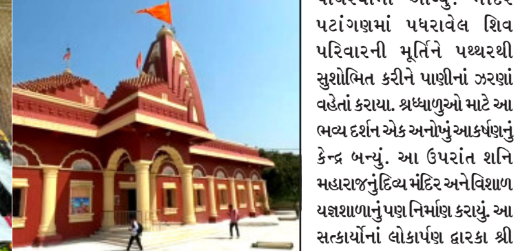
માર્ગદર્શન હેઠળ ચાર કરોડનાં વિકાસ કાર્યો કરાયા. મંદિરનાં વિશાળ પટાંગણમાં મારબલ પાથરવામાં આવ્યું. મંદિર પટાંગણમાં પથરથી સુશોભિત કરીને પાણીનાં ઝરણાં વહેતાં કરાયા. શ્રધ્ધાળુઓ માટે આ ભવ્ય દર્શન એક અનોખું આકર્ષણનું કેન્દ્ર બન્યું. આ ઉપરાંત શાનિ મહારાજનું ટિલ્ચ મંદિર અને વિશાળ યજ્ઞશાળાનું પણ નિર્માણ કરાયું. આ સત્કાર્યોનાં લોકાર્પણ દ્વારકા શ્રી શારદા મઠનાં શંકરાચાર્ય પ.પૂ.શ્રી દંડીસ્વામી મહારાજનાં હસ્તે કરવામાં આવ્યું હતું.