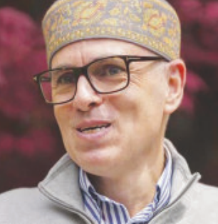
નવી દિલ્હી - જમ્મુ તા. ૯ જમ્મુ-કાશ્મીરમાં મુખ્યમંત્રી પદે બિરાજમાન થવા જઈ રહેલા