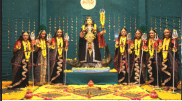
(પ્રતિનિધિ દ્વારા) રાજકોટ તા.૧૨ શ્રી ખોડલધામ ટ્રસ્ટ-કાંગવડ દ્વારા ગુજરાતભરમાં ફૂલ ૩૭ જગ્યાએ નવરાત્રિ મહોત્સવનું જાજરમાન આયોજન કરવામાં આવ્યું છે. જેમાં રાજકોટ શહેરના ચાર અલગ અલગ ઝોનમાં ભવ્યાભિવ્ય નવરાત્રિ મહોત્સવ

આઠમાં નોરતે માં ખોડલની મહાઆરતી કરવામાં આવી : માતાજીના સ્વરૂપમાં સજ્જ થયેલી દીકરીઓ રથમાં બિરાજ : આતશબાજીથી અલૌકિક અને અદ્ભુત દ્રશ્યો સર્જ્યા