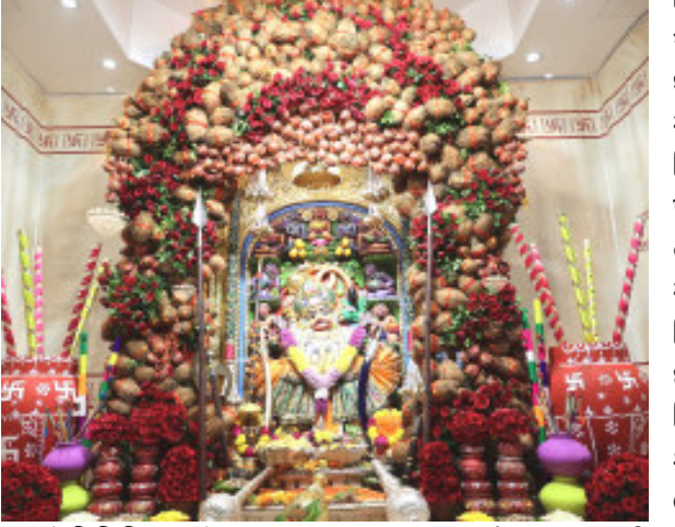
(પ્રતિનિધિ દ્વારા) સાત્રાધામ સાળંગપુરધામ શ્રી સાળંગપુર તા.૧૨ વડતાલધામ દિશતાબ્દી માટે પ.પૂ.શાસ્ત્રી સ્વામી મહોત્સવના ઉપલક્ષમાં શ્રી સ્વામિનારાયણ મંદિર (અચાણાવાળા) ની પ્રેરણાથી વડતાલધામ સંચાલિત સુપ્રસિદ્ધ તેમજ કોઠારીશ્રી

યાત્રાધામ સાળંગપુરધામ શ્રી સાળંગપુર તા.૧૨ વડતાલધામ દિશતાબ્દી માટે પ.પૂ.શાસ્ત્રી સ્વામી મહોત્સવના ઉપલક્ષમાં શ્રી સ્વામિનારાયણ મંદિર (અચાણાવાળા) ની પ્રેરણાથી વડતાલધામ સંચાલિત સુપ્રસિદ્ધ તેમજ કોઠારીશ્રી