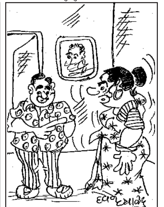
મને તો શંકા છે કે તારે કારણે જ મોંઘવારી વધી રહી છે!