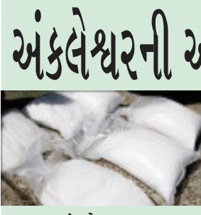
અંકલેશ્વર, તા.૨૧ : ગુજરાતમાં ડ્રગ્સનો કાળો કારોબાર યથાવત રહ્યો છે. જેમાં ભરૂચ જિલ્લામાં ફરી એકવાર ડ્રગ્સ ઝડપાયું છે. અંકલેશ્વર

અંકલેશ્વરની અવસર કંપનીમાંથી રૂ. ૨૫૦ કરોડનું ડ્રગ્સ ઝડપાયું : ડ્રગ્સનાં કાળા કારોબારનું એપી સેન્ટર ગુજરાત