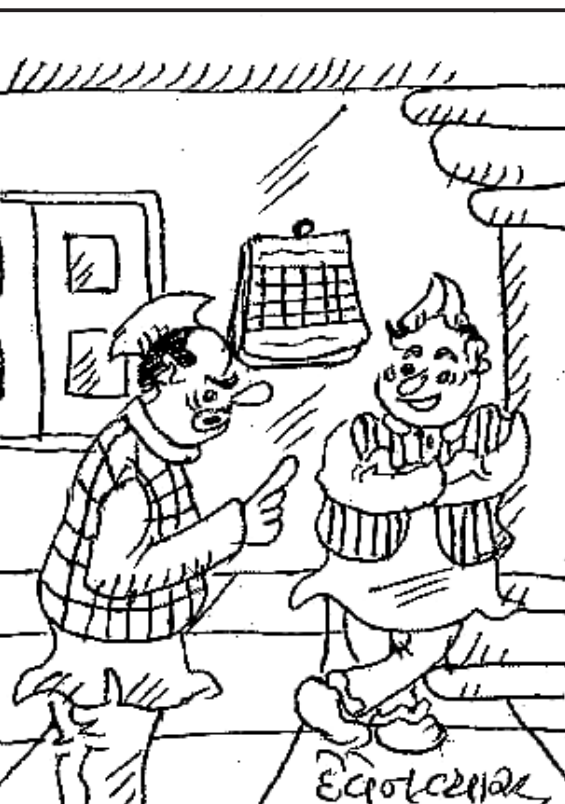
રાજકારણમાં રહીએ પછી આપણને ક્યારેય અંતર આત્માનો અવાજ સંભળાય ખરો?

રોગોનું જોખમ વધી જાય છે. જ્યારે મીઠાથી દર વર્ષે થતા મૃત્યુની વાત કરીએ તો વિશ્વ આરોગ્ય સંગઠનનો અંદાજ છે કે દર વર્ષે વિશ્વભરમાં મીઠાને કારણે લગભગ ૧૮.૯ લાખ લોકોના મૃત્યુ થાય છે. આ મૃત્યુમાં મીઠાની ભૂમિકા સીધી રીતે નથી હોતી. પરંતુ જો રોગોથી લોકોના મૃત્યુ થાય છે, તેમના થવા અને વધવામાં મીઠાની ભૂમિકા હોય છે. આ જ કારણ છે કે આરોગ્ય નિષ્ણાંતો હંમેશા સલાહ આપે છે કે મીઠાનો ઓછામાં ઓછો ઉપયોગ કરવો જોઈએ. આ પ્રકારની સલાહ લોકોને ખાંડ માટે પણ આપવામાં આવે છે.