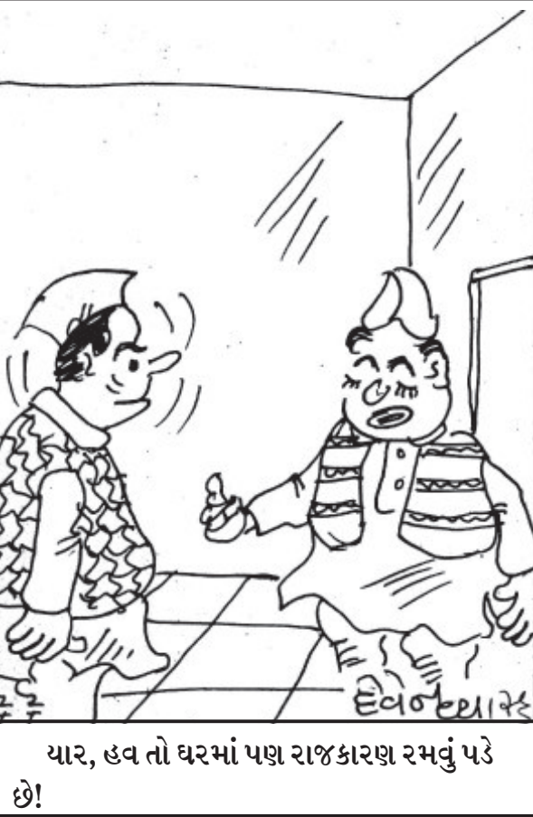
યાર, હવ તો ઘરમાં પણ રાજકારણ રમવું પડે છે!