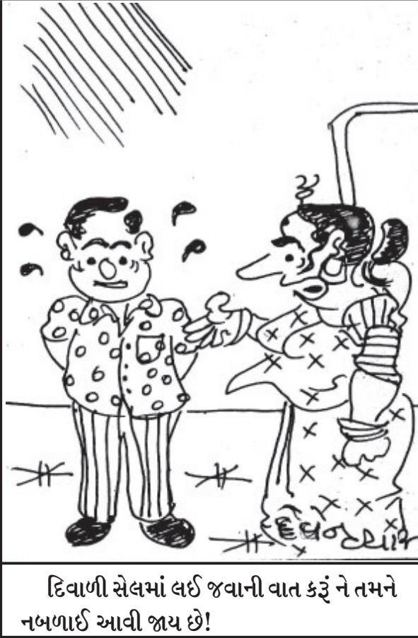
દિવાળી સેલમાં લઈ જવાની વાત કરું ને તમને નબળાઈ આવી જાય છે!