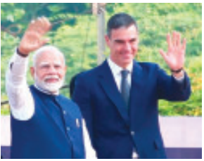
વડોદરા તા. ૨૮ : ભારત અને સ્પેનના વડાપ્રધાન ગુજરાતના મહેમાન બન્યા છે. વડોદરાના આંગણે આજે નરેન્દ્ર મોદી અને પેડ્રો સાંચેઝનો ભવ્ય રોડ શો યોજાયો હતો.

બંને વડાપ્રધાનને આવકારવા રોડની બંને સાઈડ મોટી સંખ્યામાં લોકો ઉમટ્યા હતા. બંને વડાપ્રધાન ખુલ્લી જખમાં લોકોનું અભિવાદન ઝીલ્યું હતું. ત્યારે લોકોએ મોદી...મોદી...ના નારા લગાવ્યા હતા. બાદમાં પીએમ નરેન્દ્ર મોદી અને પેડ્રો સાંચેઝે ભારતના પ્રથમ C-295 એરક્રાફ્ટ ફાઈનલ એસેમ્બલી લાઈનનું ઉદ્ઘાટન કર્યું હતું. ટાટા એરક્રાફ્ટ