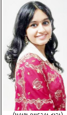
(પ્રકાશ ભાદરકા દ્વારા)

જૂનાગઢ તા.૨૯ આજનો યુગ ફાસ્ટ યુગ છે અને તેમાં પણ કોઈ ક્ષેત્રમાં કોઈએ પોતાની તેજસ્વીતા દર્શાવી હોય અને પ્રગતિના સોપાન ઉપર કદમ માંડ્યા હોય ત્યારે આપણે વાત વાતમાં કહેતા હોય છે કે, 'આપણે હિર બતાવ્યું છે' આ કહેવતને સાર્થક કરતી