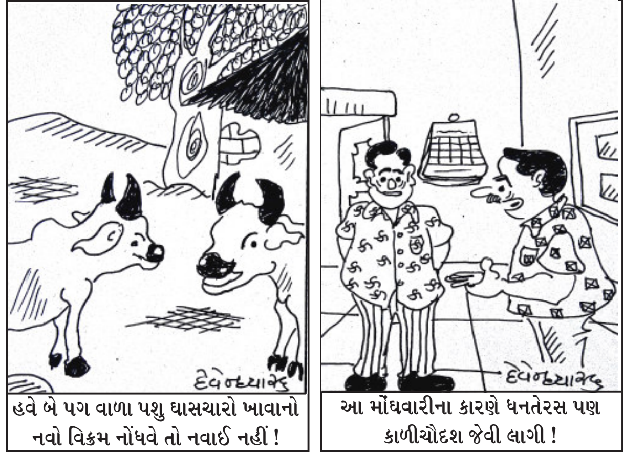
હવે બે પગ વાળા પશુ ઘાસચારો ખાવાનો નવો વિક્રમ નોંધવે તો નવાઈ નહીં ! આ મોંઘવારીના કારણે ધનતેરસ પણ કાળીચૌદશ જેવી લાગી !