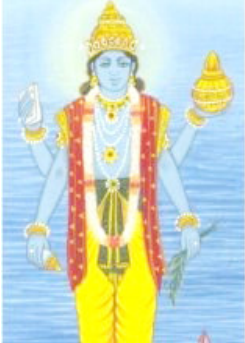
(પંકજ ઝીબા દ્વારા)