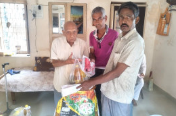
જલારામ અન્નપૂર્ણા ગૃહની વધુ એક સેવા