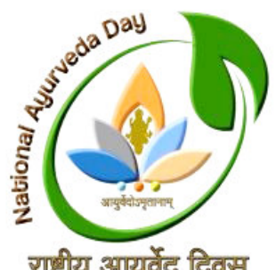
રાષ્ટ્રીય આયુર્વેદ દિવસ

શરૂકોટ તા.૩૦ દિવાળીના તહેવારની શરૂઆત એટલે “ધનતેરસ”. જેને “ધનંતરી જયંતિ” તરીકે પણ ઉજવવામાં આવે છે. ભારતીય સંસ્કૃતિમાં ભગવાન ધનંતરીને વેદ અને પુરાણોમાં “દેવતાઓના વેદ” કહેવામાં આવે છે, સાથે જ તેમને “આયુર્વેદ”ના પિતા પણ માનવામાં આવે છે. દવાની સૌથી જૂની પદ્ધતિ એટલે “આયુર્વેદ”. જે લોકોને આરોગ્ય અને સુખાકારી બક્ષી સક્ષમ બનાવે છે. તેથી જ ભારત સરકારના આયુષ મંત્રાલય દ્વારા અતિ પ્રાચીન એવી આયુર્વેદિક સારવારને પ્રોત્સાહન આપવા માટે આયુર્વેદના ભગવાનની જન્મજયંતિના રોજ દર વર્ષે “રાષ્ટ્રીય આયુર્વેદ