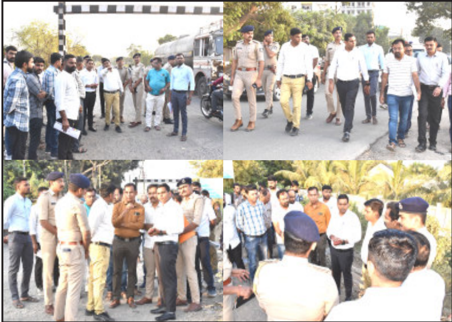
મુશ્કેલીઓ દૂર કરવા માટે અધિકારીઓ સાથે પરામર્શ બ્રેકર મુકવા, માર્ગ મરામત સ્થળ નિરીક્ષણ કર્યું હતું. કરતા રોડ ઉપર જરૂરી માર્કિંગ કરવા જરૂરી નિર્દેશ આપ્યા અને વાહન ચાલકોની જિલ્લા કલેક્ટરે કરવા, સાઈન બોર્ડ તથા સ્પીડ હતા. ઉપરાંત પાનગી

જૂનાગઢ, તા. ૧૮ સામાન્યતઃ રોડ સેફ્ટી કાઉન્સિલની બેઠક કલેક્ટર કચેરી ખાતે યોજાતી હોય છે, પરંતુ જિલ્લા કલેક્ટર અનિલકુમાર રાણાવસિયાએ ટ્રાફિકની સમસ્યાના સચોટ નિરીક્ષણ માટે 'સ્પોટ' ઉપર જ ડિસ્ટ્રિક્ટ રોડ સેફ્ટી કાઉન્સિલ બેઠક યોજી હતી. જિલ્લા કલેક્ટરે જૂનાગઢ શહેરના ચોબારી ફાટક ખાતે અને ઝાંઝરડા ચોકડી નજીક નેશનલ હાઈવે ઓથોરિટી, મહાનગરપાલિકા, માર્ગ અને મકાન, આરટીઓ, પોલીસ સહિતના સંબંધિત અધિકારીઓ સાથે ટ્રાફિકની સમસ્યા નિવારવા અને વાહન ચાલકોની