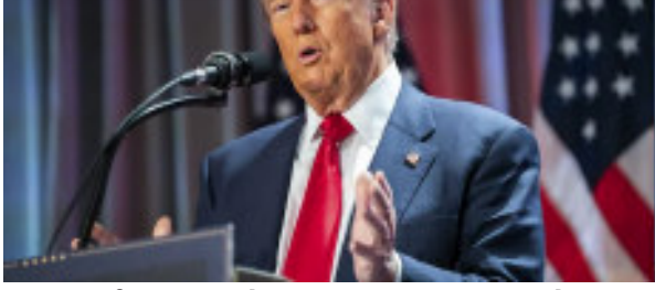
(સંપૂર્ણ સમાચાર સેવા) સરકારે આવા બાદ છેલ્લા ૧૧ વર્ષમાં અમેરિકા સહિત વિશ્વભરના દેશોમાંથી સેંકડો અમૂલ્ય પ્રાચીન વસ્તુઓની ચોરી થઈ રહ્યા છે. ભારતમાં મોટી

આવી છે. આ સંબંધમાં મેનહટનના પ્રોસીક્યુટર એલ્વિન બ્રેગે ભારતને ૧,૪૪૦ પ્રાચીન વસ્તુઓ પરત કરી છે. આમાં પવિત્ર મંદિરની મૂર્તિઓનો પણ સમાવેશ થાય છે, જેને અમેરિકા સ્મગલ કરવામાં આવી હતી. હોમલેન્ડ સિક્યુરિટી ઈન્વેસ્ટિગેશન્સ (HSI) ગ્રૂપ સુપરવાઈઝર એલેક્ઝાન્ડ્રા ડી આર્મસિએ ભારતના કોન્સુલેટ જનરલ ખાતે આયોજિત એક સમારોહમાં કલાકૃતિઓ પરત કરી હતી, એમ પ્રોસીક્યુટર ઓફિસે ગુરુવારે જણાવ્યું હતું. આ કાર્યક્રમનું પ્રતિનિધિત્વ કોન્સુલ જનરલ મનીષ કુલહારીએ કર્યું હતું. બ્રેગે કહ્યું, અમે ભારતીય સાંસ્કૃતિક વારસાને નિશાન બનાવતા અનેક ચોરી નેટવર્કની તપાસ કરવાનું ચાલુ રાખીશું. અમેરિકન એજન્સીઓ અનુસાર, આ અત્યંત પ્રાચીન વસ્તુઓ ગુનાહિત ચોરીના નેટવર્કની તપાસ દરમિયાન મળી આવી હતી. જેમાં એન્ટીક સ્મગલર્સ સુભાષ કપૂર અને નેન્સી વેઈનરનો સમાવેશ થાય છે. તમને જણાવી દઈએ કે કપૂરને ભારતમાં દોષિત ઠેરવવામાં આવ્યો હતો જ્યારે વેઈનરને અમેરિકામાં દોષિત ઠેરવવામાં આવ્યો હતો. HSI ન્યુયોર્ક સ્પેશિયલ એજન્ટ ઈન ચાર્જ વિલિયમ એસ. "આજનું વળતર એ આંતરરાષ્ટ્રીય તપાસનું પ્રતીક છે જે ઘણા વર્ષોથી ચાલુ છે," વોકરે કહ્યું. આ તપાસ ઈતિહાસના સૌથી કુખ્યાત ગુનેગારોમાંથી એક દ્વારા ચોરી કરાયેલી પ્રાચીન વસ્તુઓ વિશે છે." મેનહટન પ્રોસીક્યુટરના એન્ટિક્વિટીઝ દ્વારા જામ કરવામાં ન આવે ત્યાં સુધી કેટલીક પ્રાચીન વસ્તુઓ સંગ્રહાલયોમાં પ્રદર્શિત કરવામાં આવી હતી. તમને જણાવી દઈએ કે પીએમ મોદીના અમેરિકા પ્રવાસ દરમિયાન આંતરરાષ્ટ્રીય તપાસનું પ્રતીક છે જે ઘણા વર્ષોથી ચાલુ છે, વોકરે કહ્યું. આ તપાસ ઈતિહાસના સૌથી કુખ્યાત ગુનેગારોમાંથી એક દ્વારા ચોરી કરાયેલી પ્રાચીન વસ્તુઓ ભારતને સોંપી હતી.