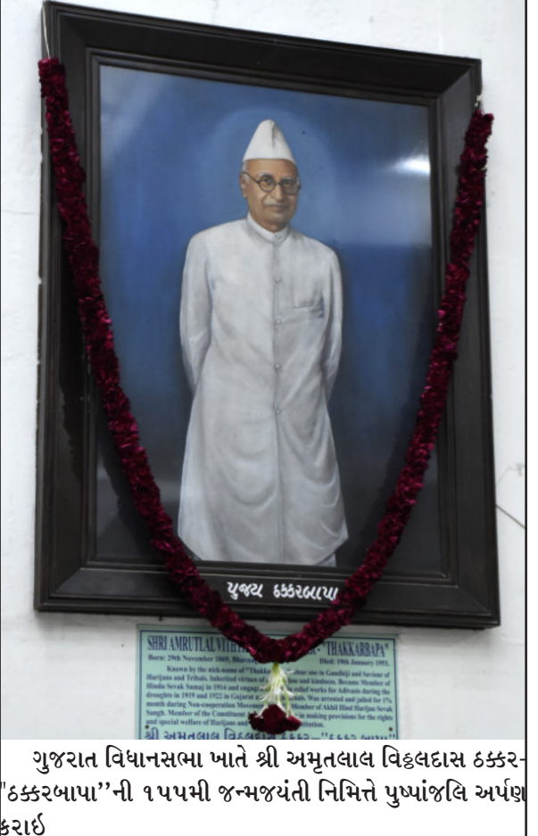
ગુજરાત વિધાનસભા ખાતે શ્રી અમૃતલાલ વિહલદાસ ઠક્કર- 'ઠક્કરબાપા'ની ૧૫૫મી જન્મજયંતિ નિમિત્તે પુષ્પાંજલિ અર્પણ કરાઈ

ગુજરાતમાં જન્મ-મરણની નોંધણી માટેની 'ઈ-ઓળખ એપ્લીકેશન' આગામી ૨૪ કલાક સુધી બંધ રહેશે